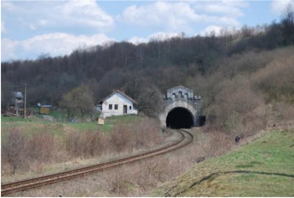
Tunelul de la Teliu – Cel mai lung tunel feroviar din România (peste 4 km)