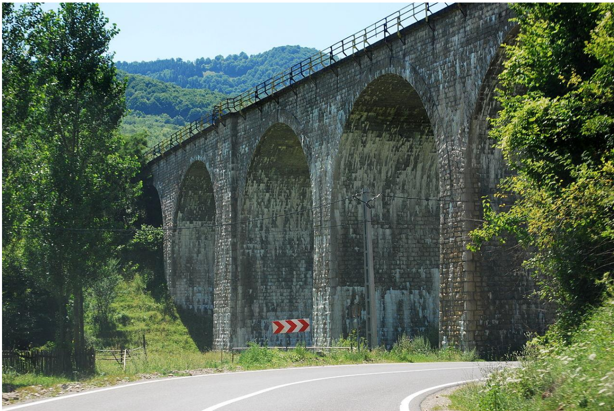
Viaduct spectaculos peste DN10, în Teliu