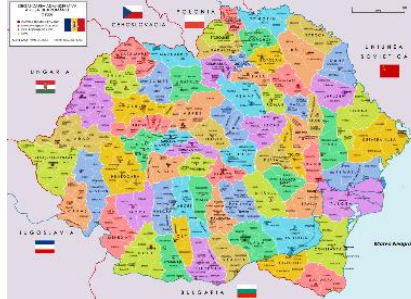
A. REFACEREA ROMÂNIEI MARI

U) Vom lupta pentru recunoașterea oficială, în etape: Refacerea României Mari - 2020, Unirea Daciei Adevărate - 2025, Dacia cea Mare - 2030, Întregirea spirituală a Daciei-2050. Crimeea aparține DacoRomâniei din antichitate; Constantinopolul european - capitala a Vechii Europe - Dacia - Rumunia- 2050.