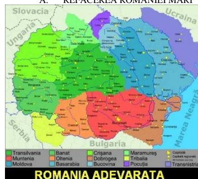
B. UNIREA DACIEI ADEVĂRATE