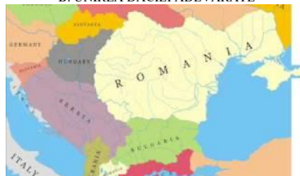
C. DACIA CEA MARE