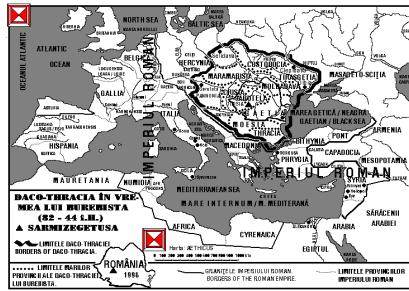
C.b. DACIA NEMURITOARE A MARELUI REGE BUREBISTA

ZONA DE FORMARE A NEAMULUI ROMÂNESC DUPĂ NICOLAE IORGA