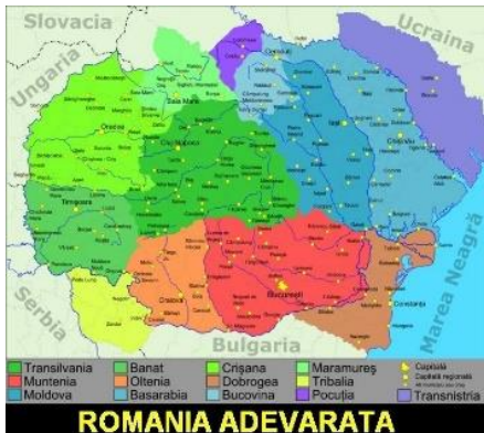
B.UNIREA DACIEI ADEVĂRATE