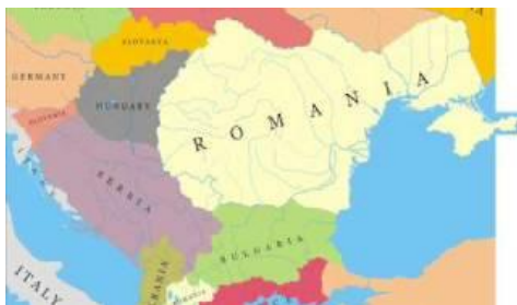
C. DACIA CEA MARE