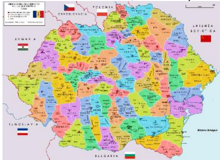
A.REFACEREA ROMÂNIEI MARI

25. Vom lupta și cu arma în mână, dacă va fi nevoie, pentru obținerea recunoașterii oficiale, pentru că, în fapt, poate fi realizată, în etape: Refacerea României Mari - 2020, Unirea Daciei Adevărate-2025, Dacia cea Mare - 2030, Întregirea spirituală a Daciei-2050. Crimeea aparține DacoRomâniei din antichitate; Constantinopolul european va fi capitala cultural-spirituală a Vechii Europe – Dacia - 2050.