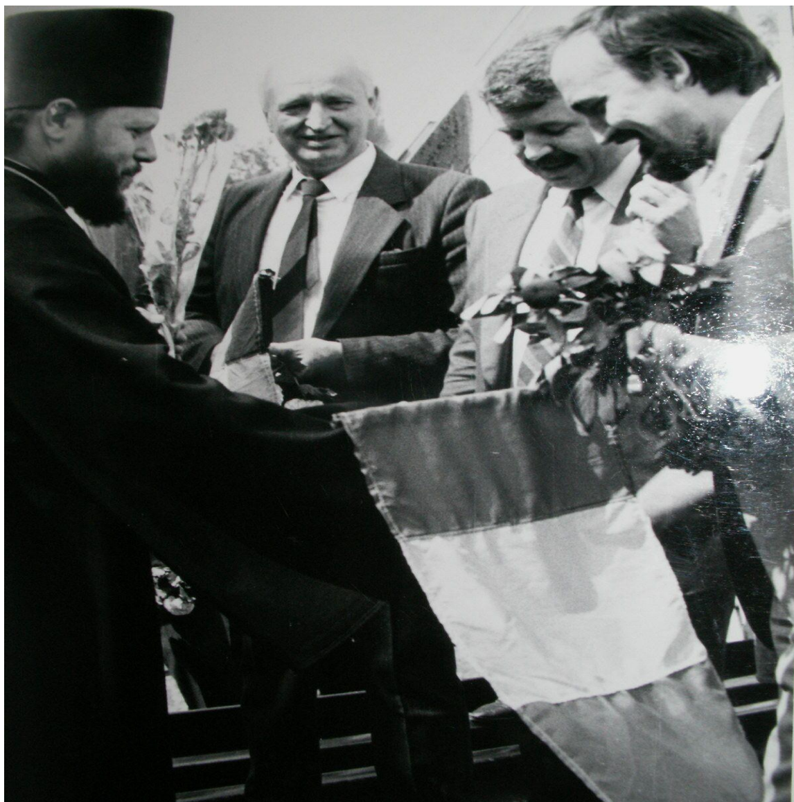
4) Delegația din partea FPM

de oameni a început să afluiască pe pod, după ei.