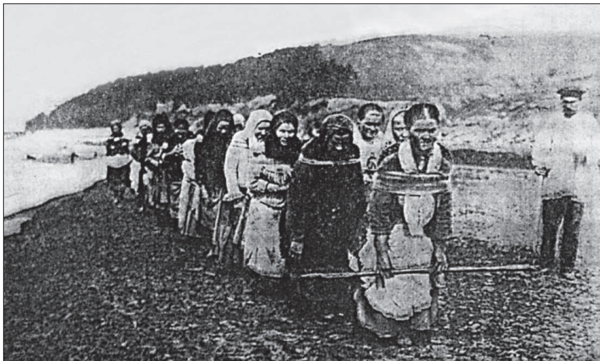
Femei remorcînd o ambarcație împotri- va cursului apei rîului Surà – afluent pe dreapta al Volgăi. (Foto 1910.)