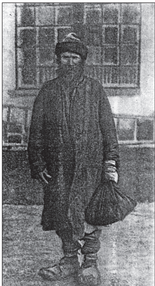
Țăran-hodok. Așa era numit țăranul rus ales pentru a se deplasa în capitala Imperiului și a cere Dumei de Stat recunoașterea și respectarea drepturilor țăranilor. (Foto 1906.)