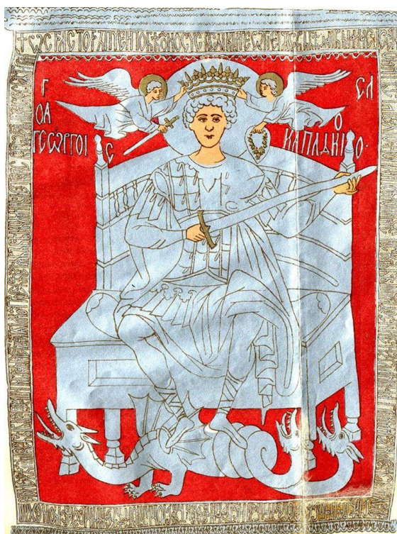
Stindardul lui Ștefan cel Mare și Sfânt dăruit de domnitor, în anul 1500, Mănăstirii „Sf. Gheorghe” Zografu, de la Muntele Athos – în prezent aflat în colecțiile MNIR București