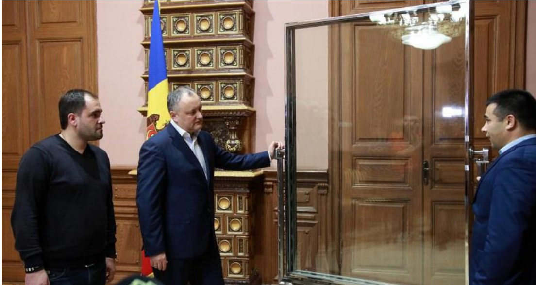
Suportul – vitrină oferit de Presedintele Republicii Moldova Igor Dodon, în anul 2017, pentru a adăposti și proteja steagul lui Ștefan cel Mare aflat la Mănăstirea Zografu din Muntele Athos