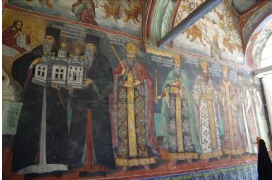
Mănăstirea Zografu din Sfântul Munte Athos