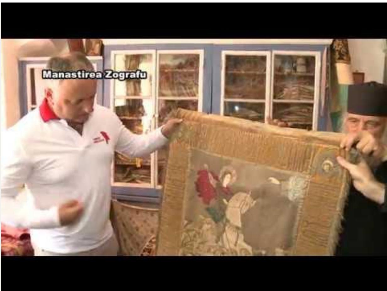
Presedintele Republicii Moldova Igor Dodon, în anul 2017, la Mănăstirea Zografu din Muntele Athos, cu steagul lui Ștefan cel Mare