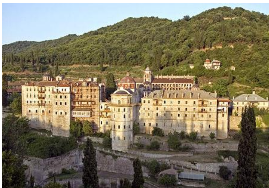
Mănăstirea Zografu din Sfântul Munte Athos – vedere generală