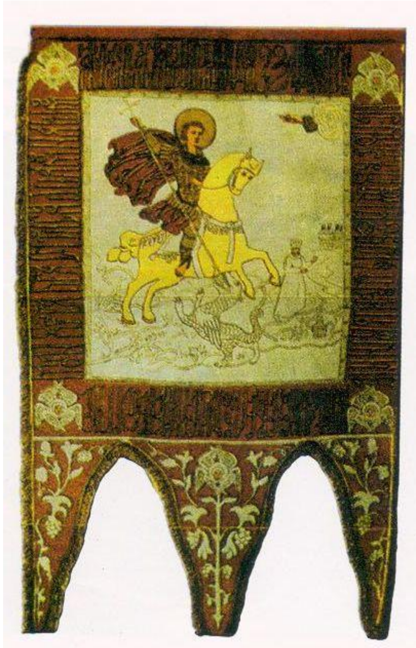
Acesta este cel de al doilea steag al marelui domnitor Ștefan cel Mare, aflat la Mănăstirea Zografu, din Muntele Athos.