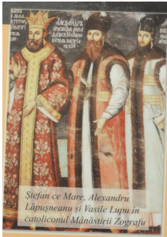
Ștefan ce Mare, Alexandru Lăpușneanu și Vasile Lupu în catoliconul Mănăstirii Zografu