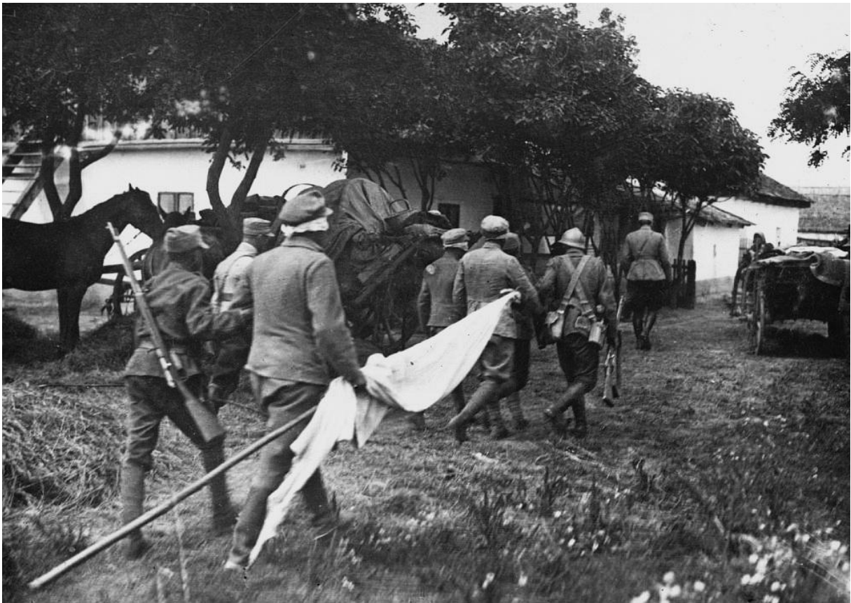
Hungarian- Romanian_War_of_1919_(National_Military_Museum_Collection)_34 (1)