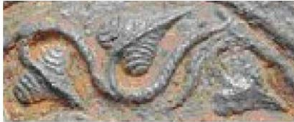
disc din fier, Cetatea dacică Piatra Roșie, secolele II î.e.n. – I e.n