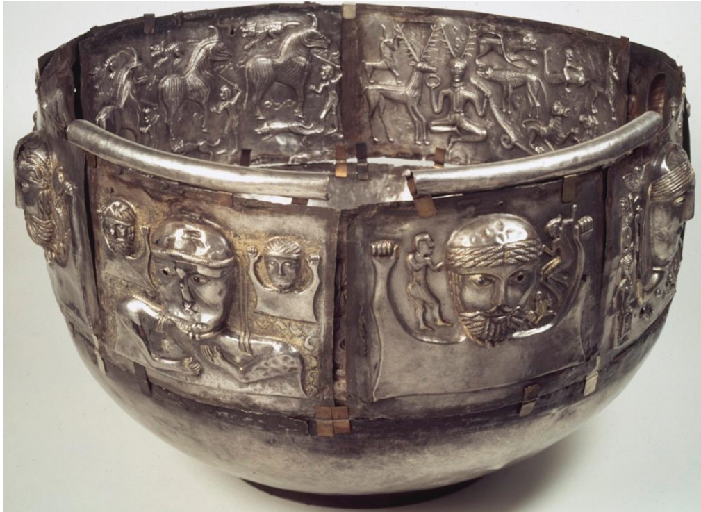
Cazanul Gundestrup, descoperit în Danemarca – Friza capetelor umane (nemurirea; revenirea sufletului în alt corp uman; repetiția)