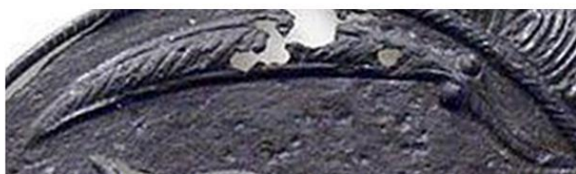
disc din fier, Cetatea dacică Piatra Roșie, secolele II î.e.n. – I e.n