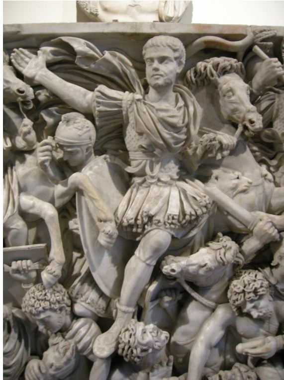
Ludovisi Battle Sarcophagus, 250-260 e.n., Museo Nazionale Romano-Palazzo Altemps, Roma. În dreapta sus apare draconul dacic.