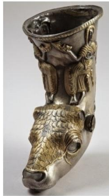
rhytonul de la Mehedinți, secolele IV-III î.e.n.