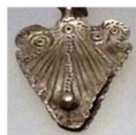
fibulă din argint, Ostrovul Mare, sec. IV î.e.n.