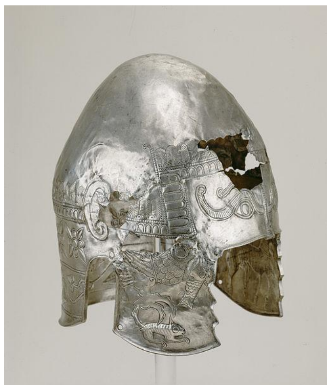
Mama Gaya Vultureanca pe obrăzar – Coif getic argint Porțile de Fier (astăzi la Detroit – SUA)