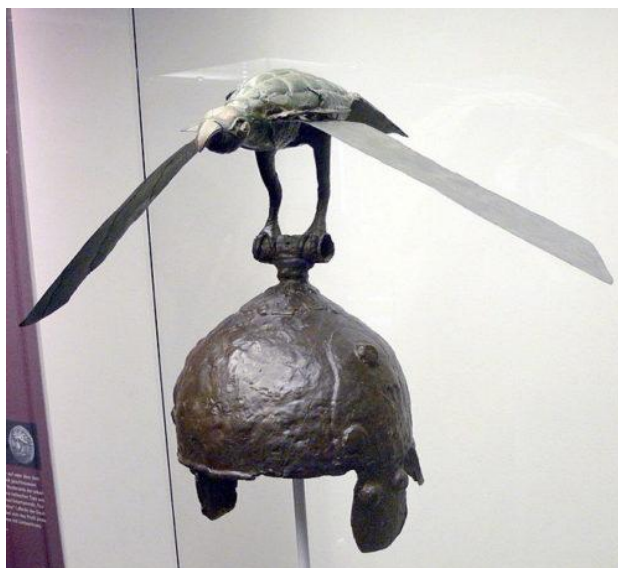
Coiful declarat ca „celtic” descoperit la Ciumești (România) – Mama Gaya Vultureanca