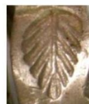
brățară din argint, Vălișoara