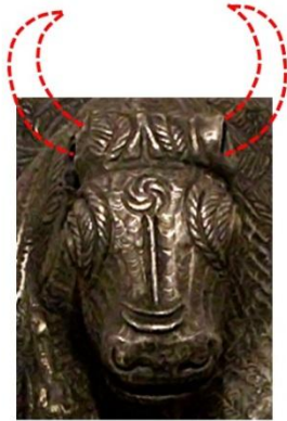
vas din argint, Gundestrup, Danemarca, secolul I î.e.n.

Rozeta spiralată, simbol derivat pentru reprezentarea discului solar, în fruntea capului de taur