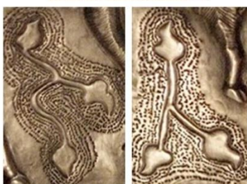
vas din argint, Gundestrup, Danemarca, secolul I î.e.n.