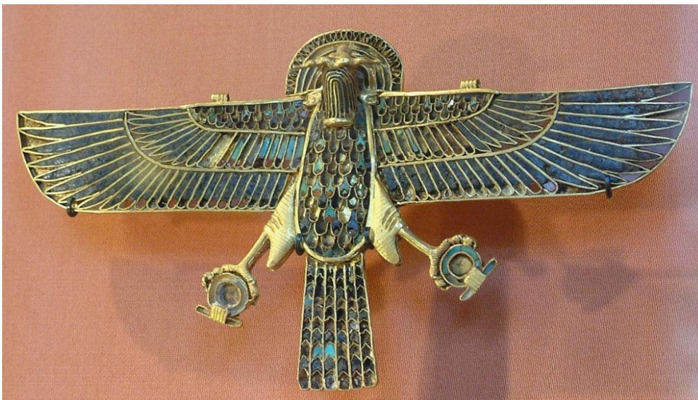
Horus – Zeul cerului la egiptenii antichi