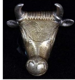
tezaurul de la Craiova, secolul IV î.e.n.

Toți bourii au stele în frunte (rozete spirale, simbol solar): Vasul de la Gundestrup (sec. I î.Hr), Rhytonul de la Mehedinți (sec. IV – III î.Hr) și aplică din Tezaurul de la Craiova (sec. IV î.Hr.).