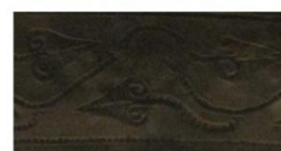
coifuri din argint, sudul României, secolul IV î.e.n.