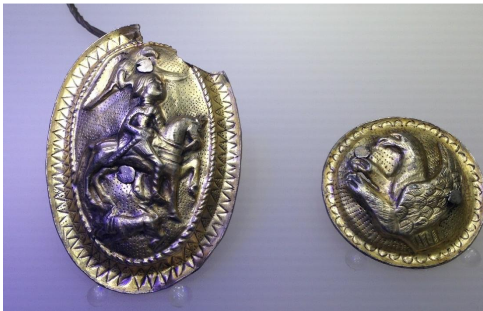
Falere din tezaurul de la Surcea, județul Covasna (secolul I î.Hr.). Faléra era un ornament care se purta la gât, ca medalion: