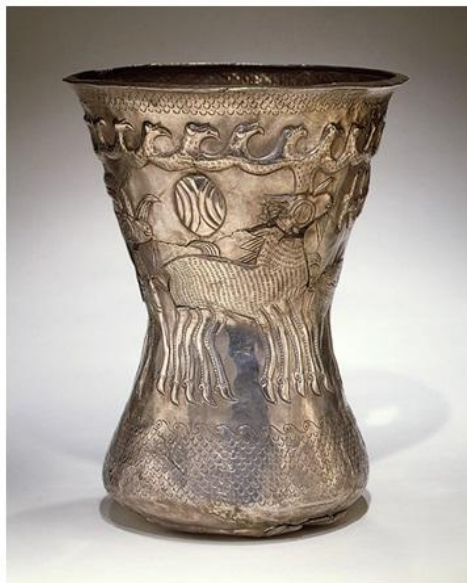
Paharul bitronconic ritualic al Sarabhei Metropolitan Museum - New York, U.S.A.