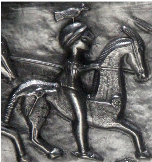
cavaler, vas din argint, Gundestrup, Danemarca, secolul I î.e.n.