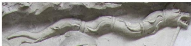
basorelief, Columna lui Traian, Italia, 113 e.n.