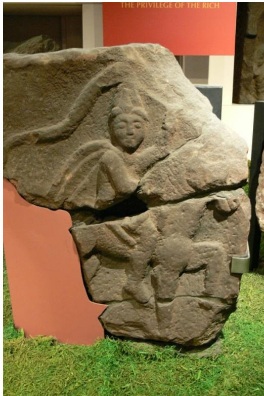
Chester, Anglia, Grosvenor Museum, călăreț dac purtând dragonul dacic, luptând în trupele romane.