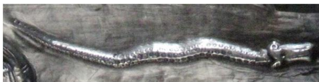
vas din argint, Gundestrup, Danemarca, secolul I î.e.n.