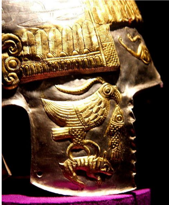
Mama Gaya Vultureanca pe obrăzar – Coif getic argint aurit Peretu