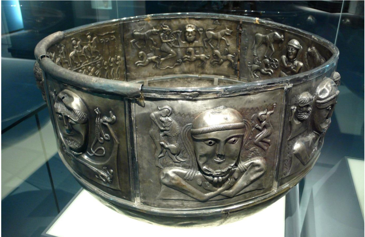
Cazanul Gundestrup, descoperit în Danemarca