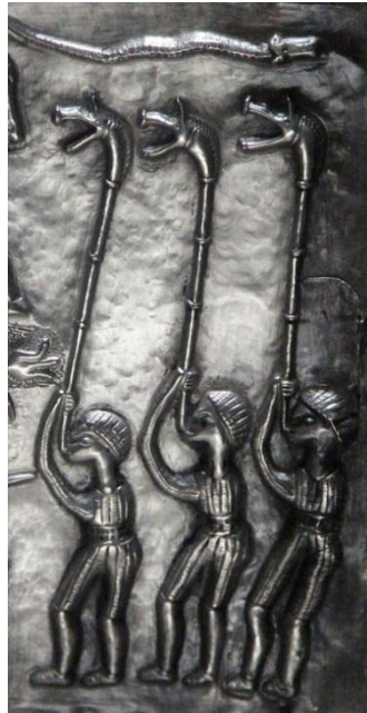
Instrumente muzicale dacice