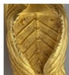
brățară din aur, Sarmisegetuza Regia, sec. II-I î.e.n.