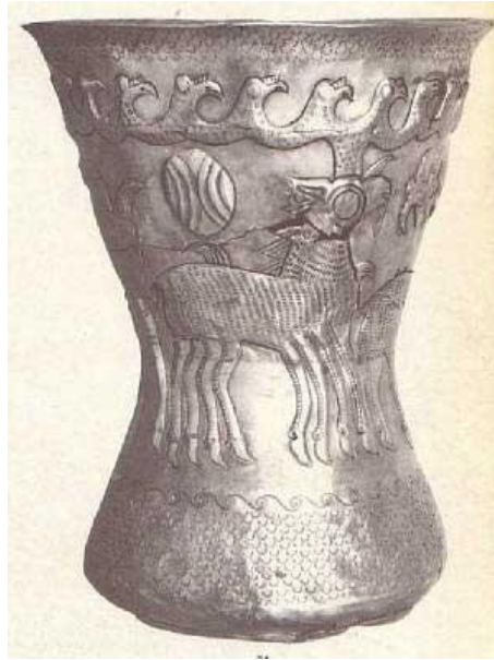
Tezaurul princiar getic de la Agighiol. Cerbul Sarabha (cel cu opt picioare) ce apare pe Vasele clepsidră ale Marii Uitări.