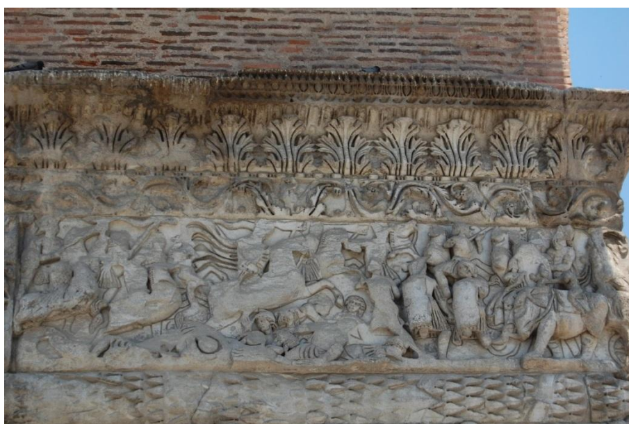
Arcul lui Galerius, 304 e.n.Salonic (Grecia). Aici apar trupele dace cu draconarii ce poartă balaurii umflați în vânt (victorioși)