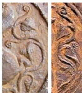
discuri din fier, Cetatea dacică Platra Roșie, secolele II î.e.n. – I e.n