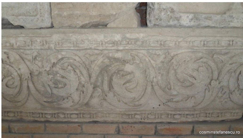
Capetele de lup cde apar din friza de acant la Biserica Omului de la Adamclisi (Monumetul Triumfal)

păstaie” ce aduce cu sine semințiile pământului, acesta fiind cu gura închisă (nu mușcă). Este un simbol vegetal – animal, așa cum apare și pe friza de acant cu capete de lup de pe Biserica Omului (Monumentul Triumfal) de la Adamclisi.