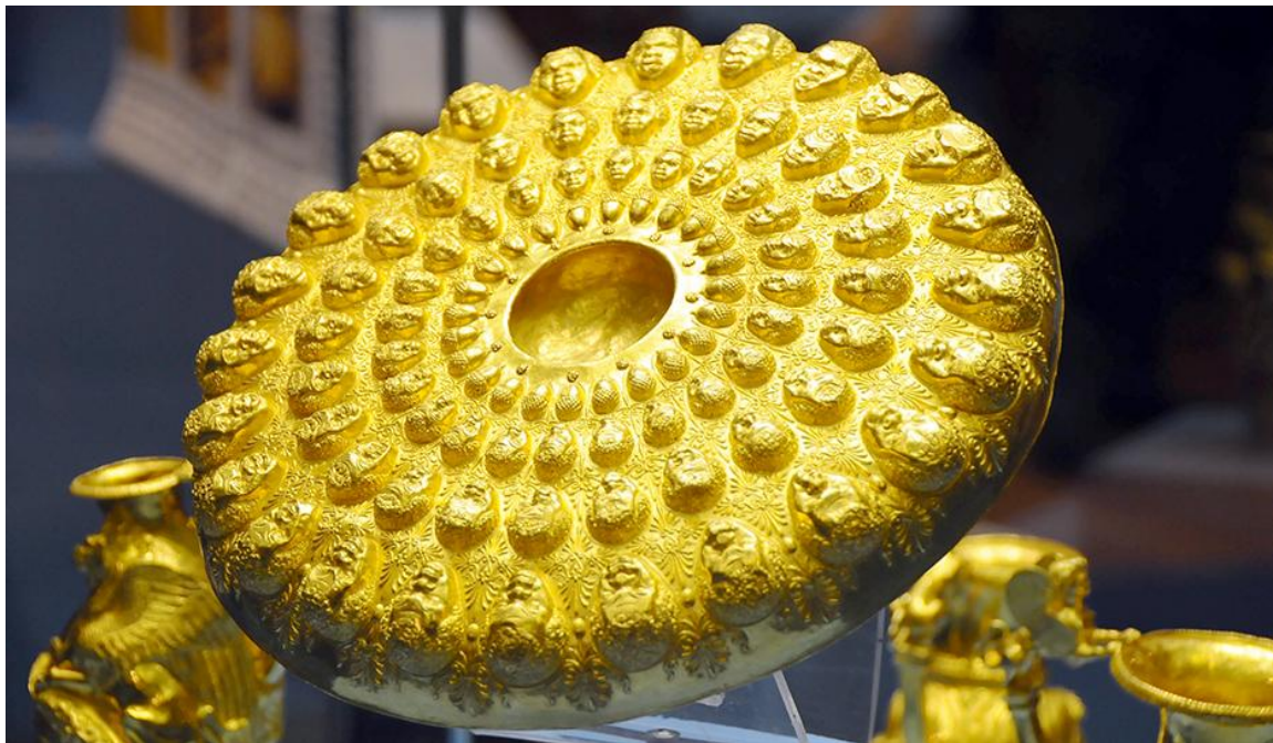
Vas cu capete umane „prezentate” – Tezaurul getic de aur de la Panaghiuriște (Bulgaria) Friza capetelor umane (nemurirea; revenirea sufletului în alt corp uman; repetiția)