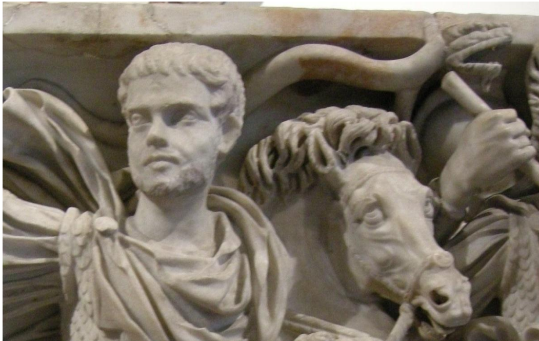
Ludovisi Battle Sarcophagus, 250-260 e.n., Museo Nazionale Romano-Palazzo Altemps, Roma. În dreapta sus apare draconul dacic, cu gura deschisă.