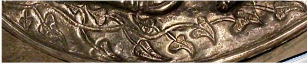
vas din argint, Gundestrup, Danemarca, secolul I î.e.n.