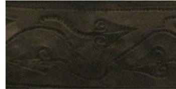
coif din argint , sudul Olteniei, secolul IV î.e.n.

Planta vieții (simbolizând nemurirea) poate fi vița de vie (pentru că nu e moartă), dar și iedera (veșnic verde). Așa apare în arta geto-daco-tracă, dar și pe Cazanul din Danemarca