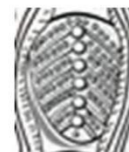
brățară din aur, Grădiștea de Munte

Planta vieții (simbolizând nemurirea) poate fi vița de vie (pentru că nu e moartă), dar și iedera (veșnic verde). Așa apare în arta geto-daco-tracă, dar și pe Cazanul din Danemarca.