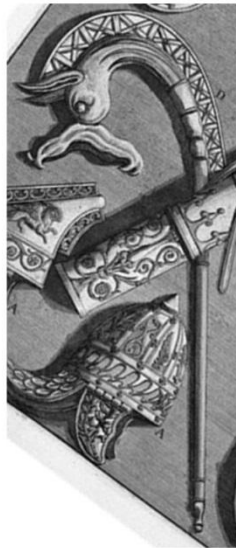
detaliu, schiță de Giovanni Batista Piranesi, Columna lui Traian, 113 e.n.