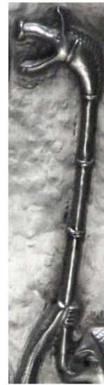
detaliu, vas din argint, Gundestrup, Danemarca, secolul I î.e.n.

Schiță ale armelor dacice reprezentate pe Columna lui Traian, executată de artistul francez Michel-François Dandr -Bardon (1700-1783), tipărită la Paris în anul 1774: