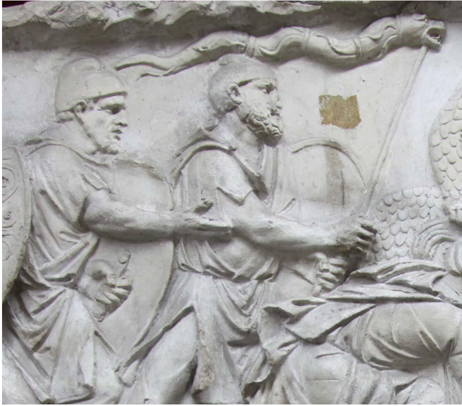
Columna lui Traian, 113 e.n.(Roma – Italia). Draconul dacic apare cu gura deschisă.