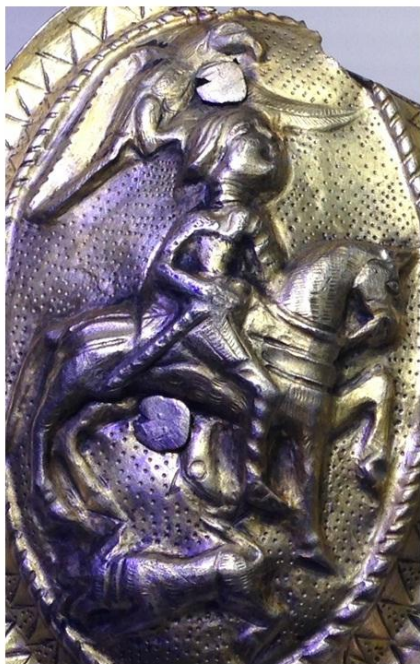
cavaler, faleră din argint, tezaurul de la Surcea, județul Covasna, secolul I î.e.n.