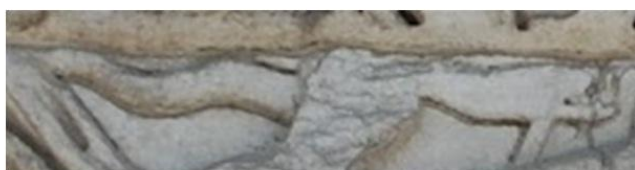
basorelief, Arcul lui Galerius, Grecia, 304 e.n.