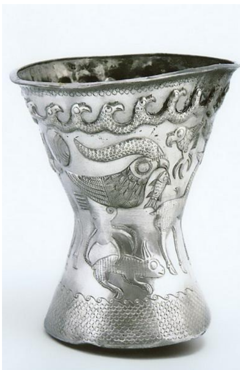
Mama Gaya Vultureanca și Puya Gaya pe vasele getice de la Agighiol