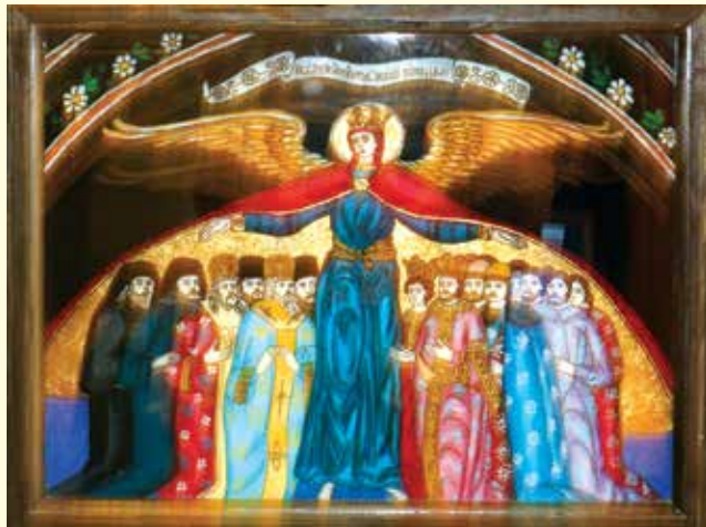
3 Ierusalim, Sensul Lumii, Editura Nemira, 2015, pg. 91

Icoana clasică a Fecioarei Maria o prezintă purtând copilul pe brațul stâng, iar cu mâna dreaptă îl arată pe Mântuitor, îl strânge la piept, subliniind latura maternă a Mariei, într-o