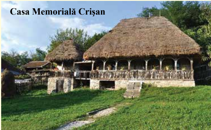
Casa Memorială Crișan

treilea conducător al revoluției din 1784, alături de Horia și Cloșca. În aceeași localitate există și Casa Memorială Vlaicu Birna scriitor, autor de mai multe volume de poezie și a două romane: „Când era Horia împărat” și „romanul Ecaterinei Varga”. Gheorghe Marcu Giurgiu cunoscut sub numele de Crișan, s-a născut în satul Vaca în anul 1732. Se știe că după ce a venit Horia de la împărat, Crișan a ținut legătura cu moșii din Țara Zarandului. La întâlnirea