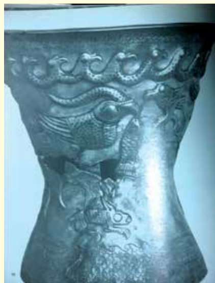
Porțile de Fier. Pahar din argint; vulturul cu corn cu un pește în cioc și un iepure în gheare.