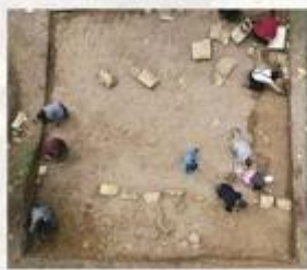
Drumul ceremonial, aspecte din timpul cercetărilor arheologice

Categoriile de artefacte aflate în decursul săpăturilor sunt, la rândul lor, notabile: mii de fragmente ceramice, materiale de construcție și unelte din fier, piese din sticlă și bronz, monede, sute de bucăți de tencuială, unele dintre ele pictate, obiecte de vestimentație.