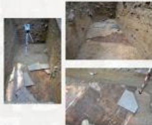
Aleea pavată, aspecte din timpul cercetărilor arheologice