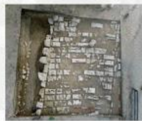
Drumul ceremonial, aspecte din timpul cercetărilor arheologice