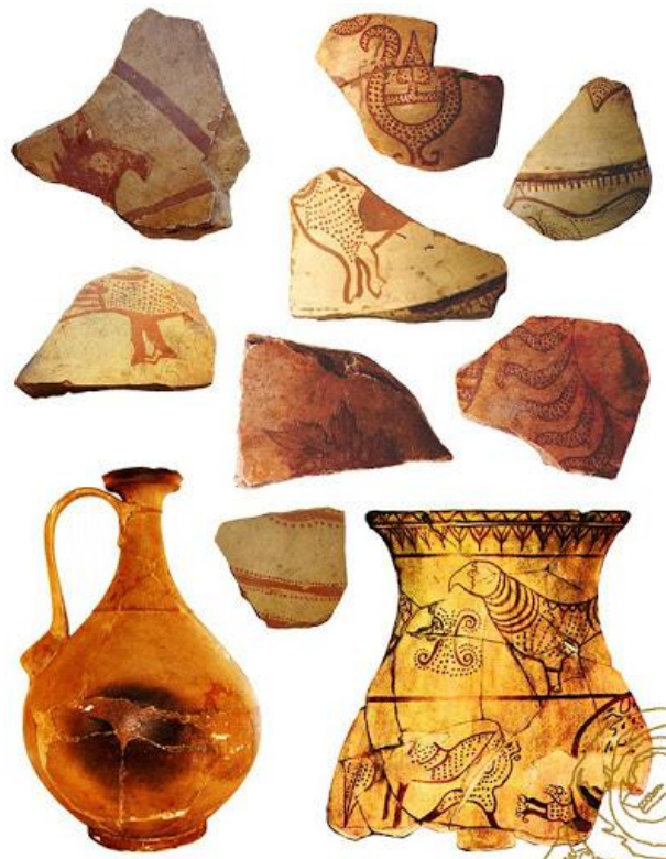
Ceramică dacică pictată descoperită la Sarmizegetusa