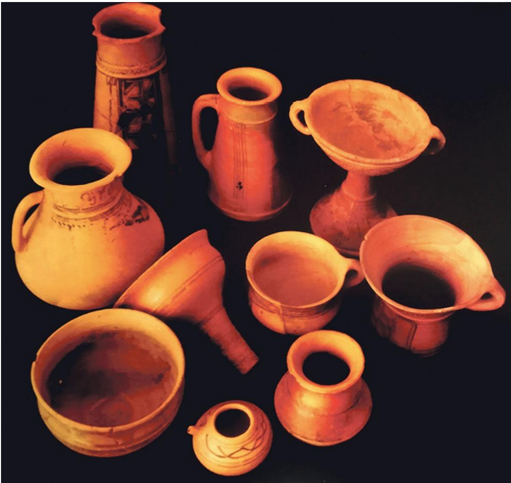
Ceramică numantină, asemănătoare cu cea dacă