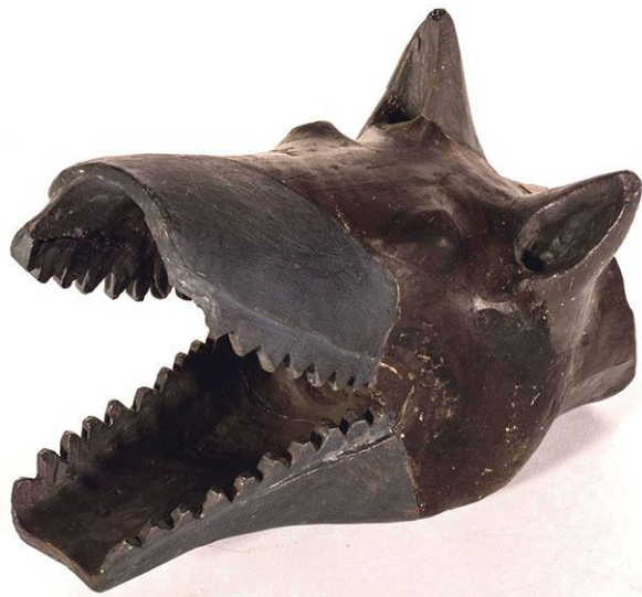
Cap de lup din teracotă, descoperit la Numancia, identic cu stindardul de luptă al dacilor