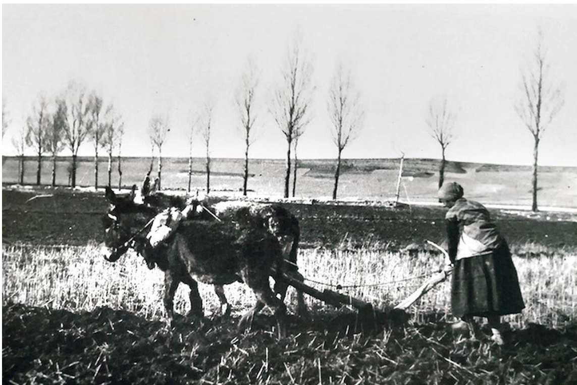
Femeie la arat în zona vechii Numancii