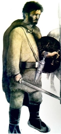
Luptător din Numancia, asemănător cu un dac autohton