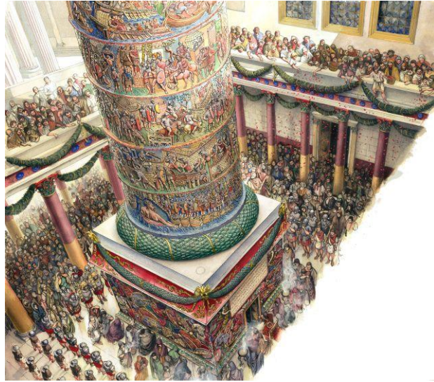
Columna lui Traian de la Roma (Italia) - Reconstituire.