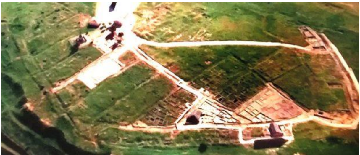
Situl de la Numancia, văzut de sus