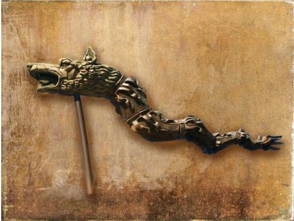
Stindardul de luptă al dacilor (cap de lup și corp de șarpe)