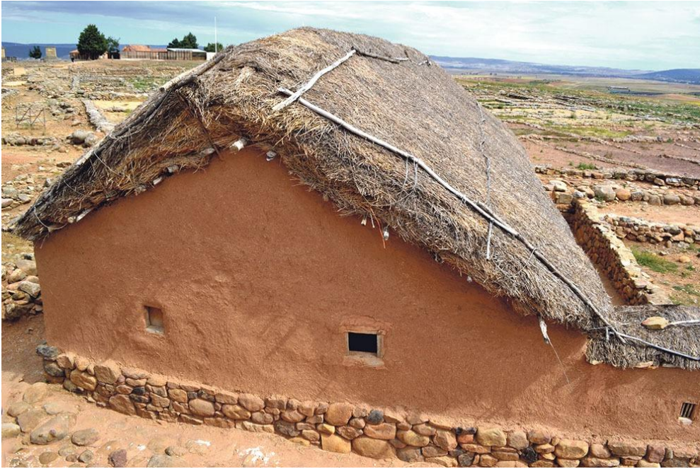
Casă numantină – reconstituire în situl arheologic