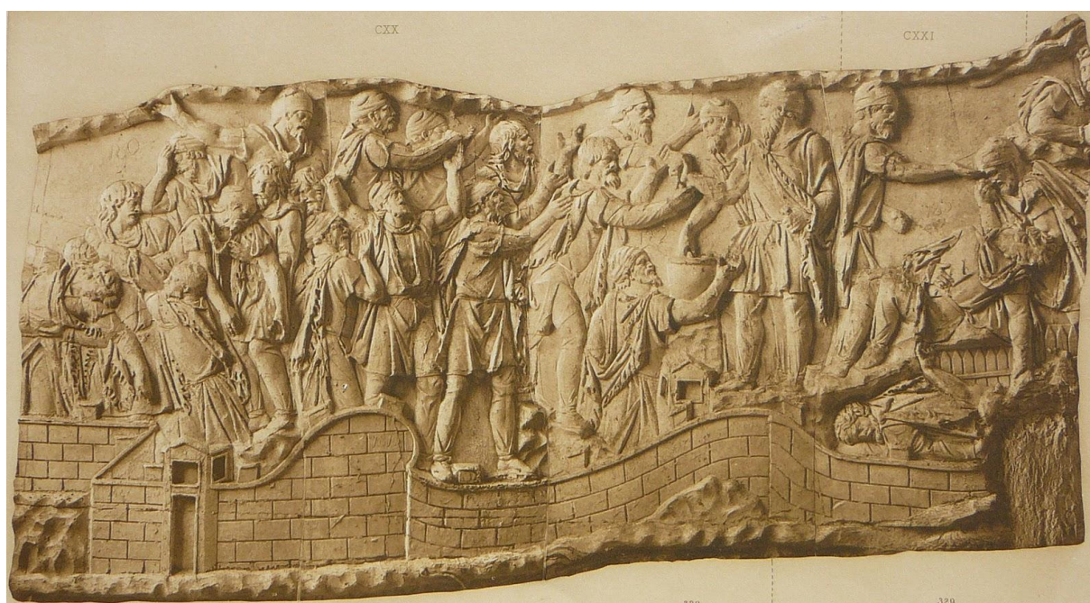
Metopele Columnei lui Traian de la Roma (Italia). Cupele cu otravă sunt date din mână în mână în cetatea asediată Samizegetusa (Dacia).