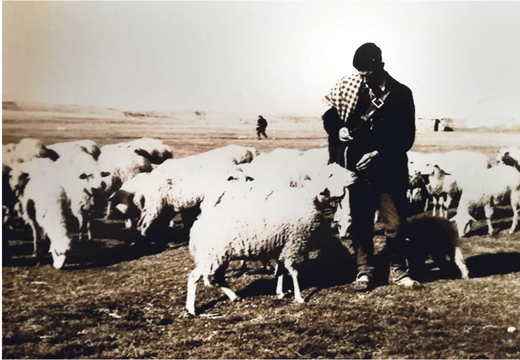
Păstor transhumant din provincia Soria. E încălțat în opinci și poartă straiță identică cu a păstorilor sibieni