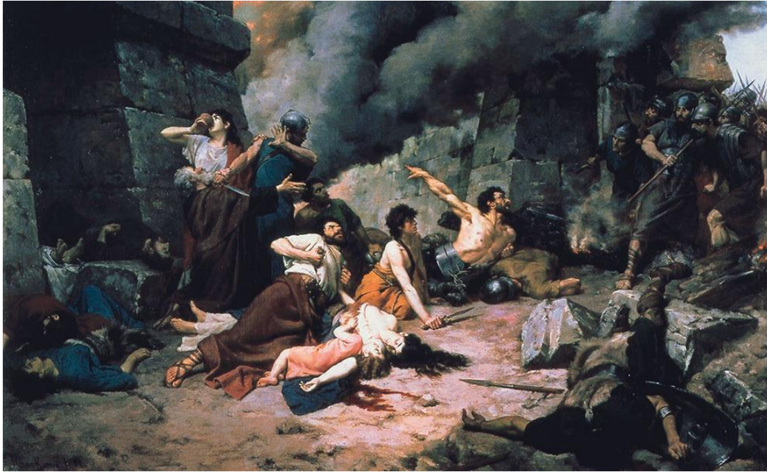
Ultima zi a Numanciei – faimosul tablou al lui Alejo Vera, de la Muzeul Prado