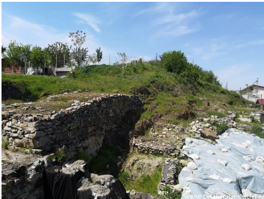
Cetatea Proslavița, capitala Rusiei Kievene (ruine)