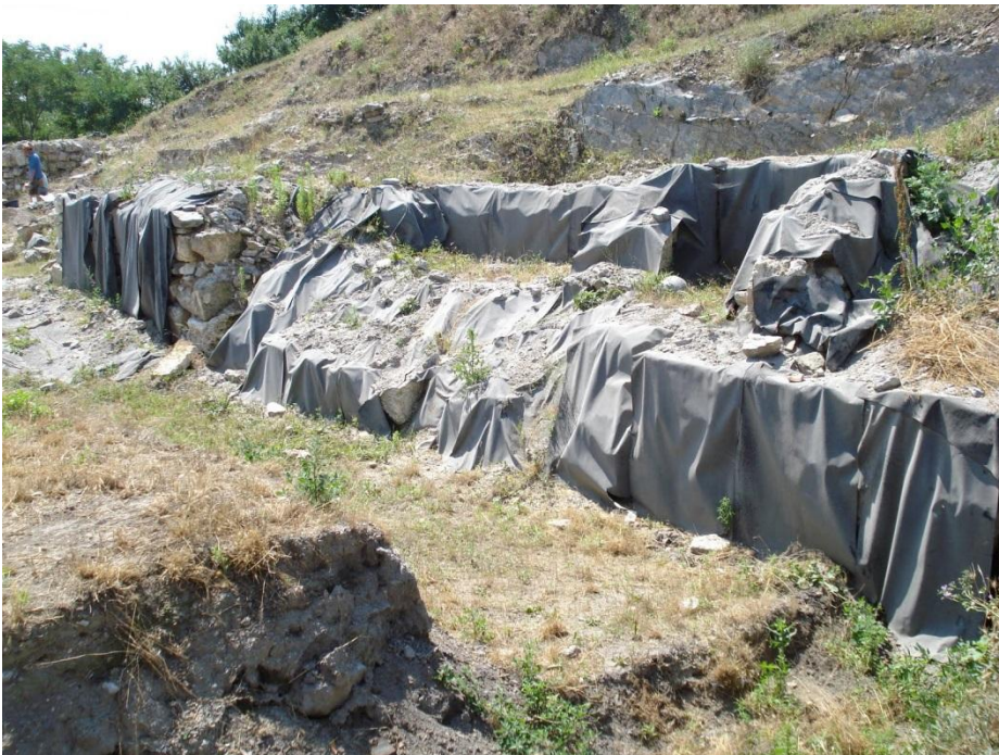
Cetatea Proslavița, capitala Rusiei Kievene (ruine)