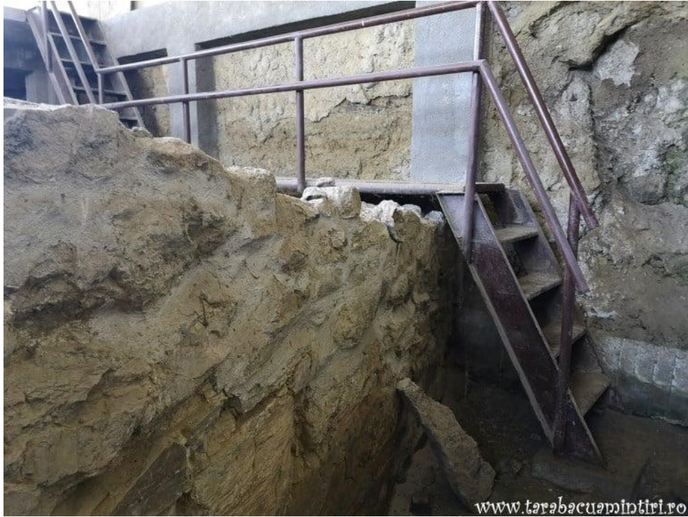
Cetatea Proslavița, capitala Rusiei Kievene (ruine)