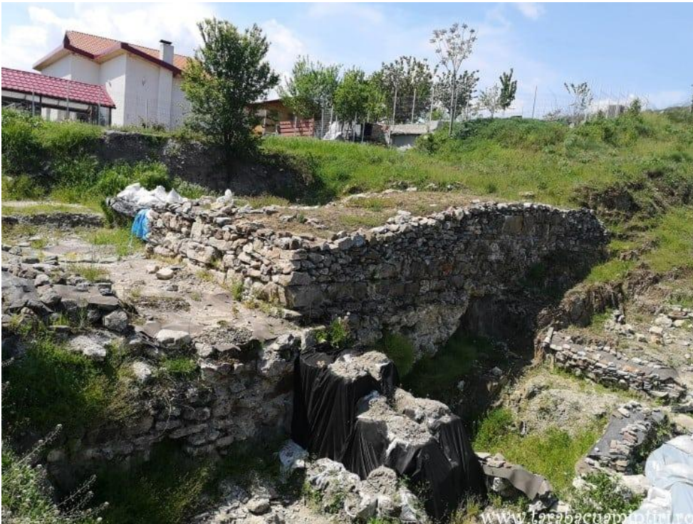
Cetatea Proslavița, capitala Rusiei Kievene (ruine)