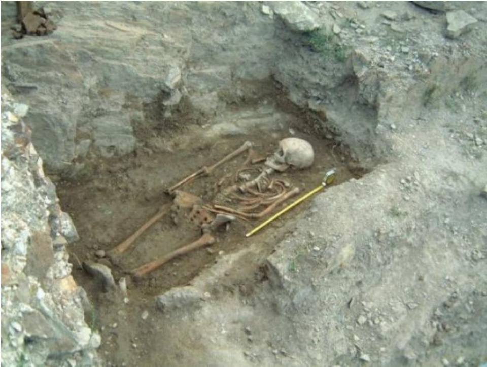
Cetatea Proslavița, capitala Rusiei Kievene (necropola)