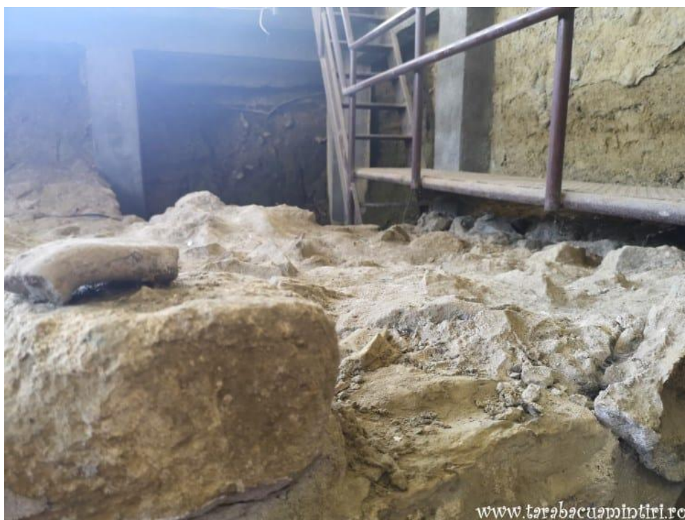
Cetatea Proslavița, capitala Rusiei Kievene (ruine)