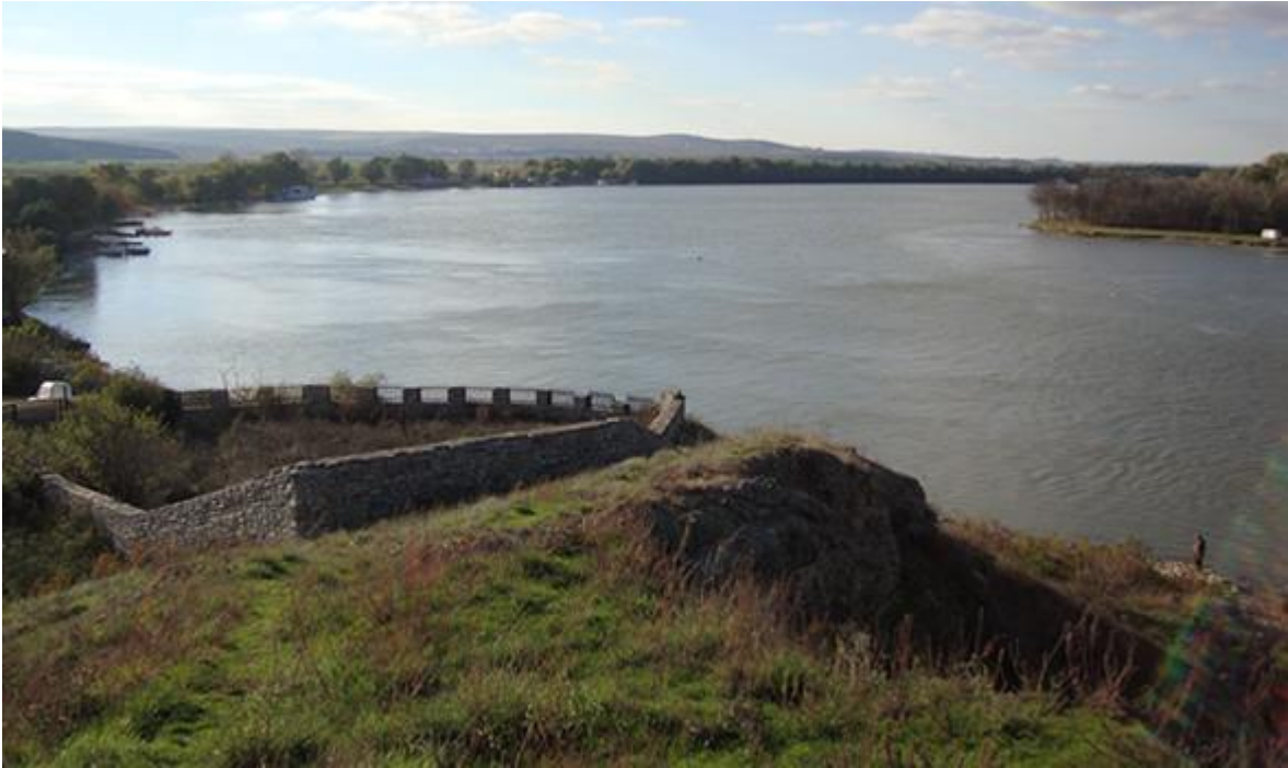
Cetatea Proslavița, capitala Rusiei Kievene (ruine)