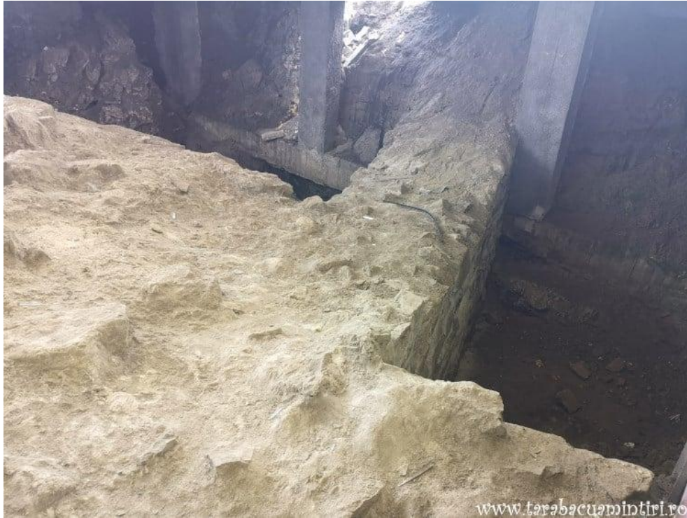
Cetatea Proslavița, capitala Rusiei Kievene (ruine)