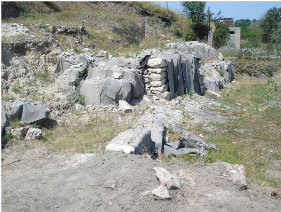
Cetatea Proslavița, capitala Rusiei Kievene (ruine)