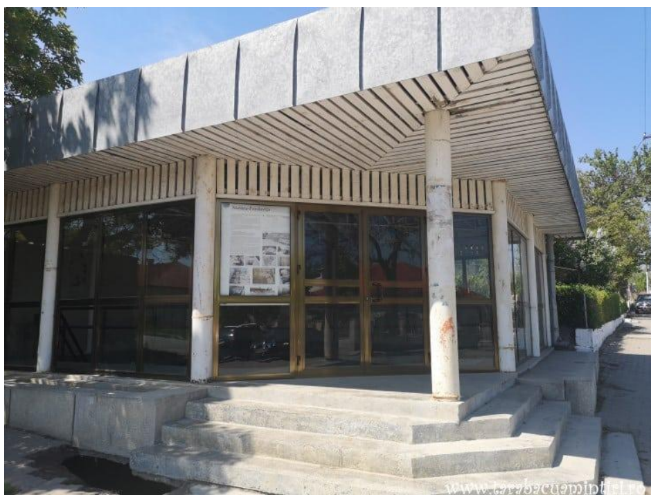
Cetatea Proslavița, capitala Rusiei Kievene. Acces la ruinele conservate.