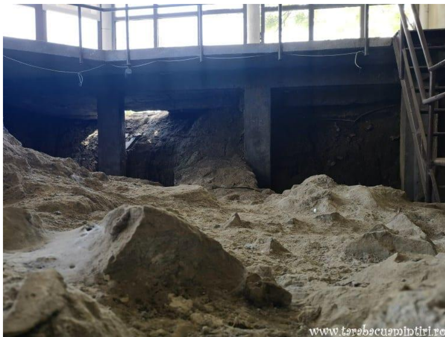
Cetatea Proslavița, capitala Rusiei Kievene (ruine)