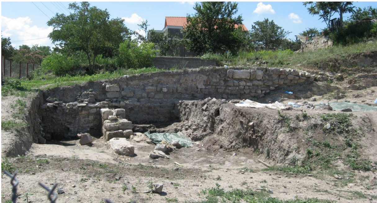
Cetatea Proslavița, capitala Rusiei Kievene (ruine)