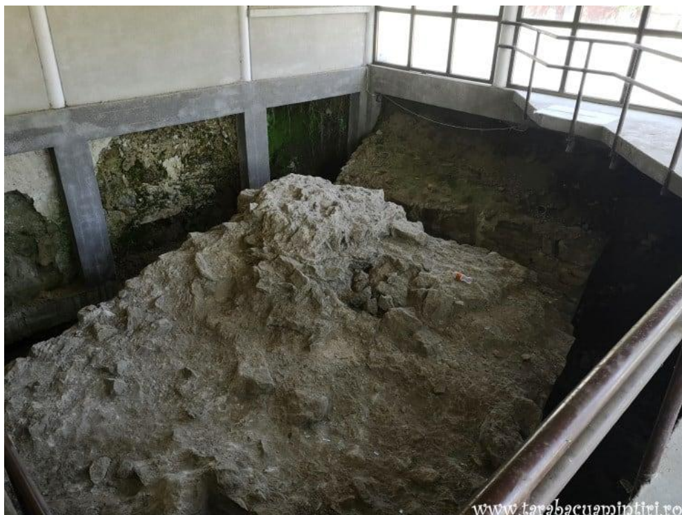
Cetatea Proslavița, capitala Rusiei Kievene (ruine)