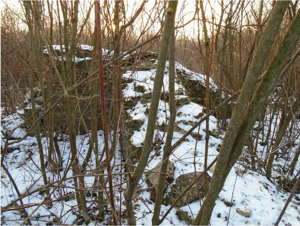
Rămășițe din zidurile Cetății Noi a Romanului cod LMI NT-I-s-A-10502