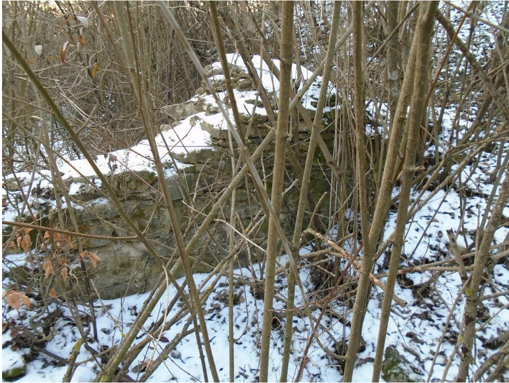
Rămășițe din zidurile Cetății Noi a Romanului cod LMI NT-I-s-A-10502