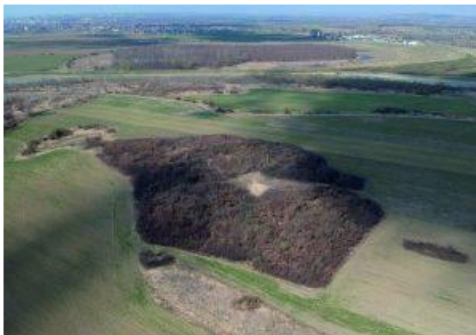
Vedere generală asupra locului în care se află ruinele Cetății Noi a Romanului