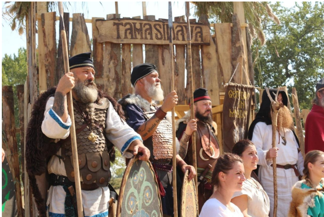
Festivalul Antic Tamasidava, editia a II-a