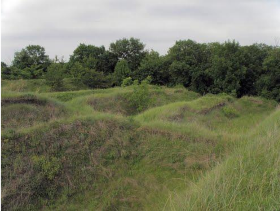
Ruinele Cetății dacice Tamisidava (jud. Bacău)