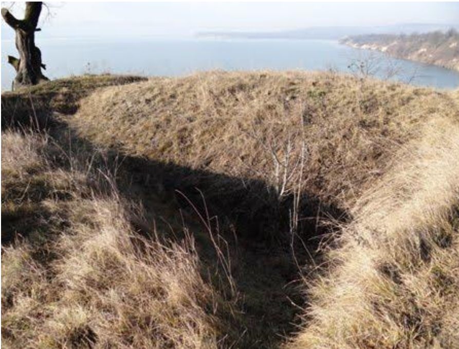
Ruinele Cetății dacice Tamisidava, de pe malul Siretului (jud. Bacău)