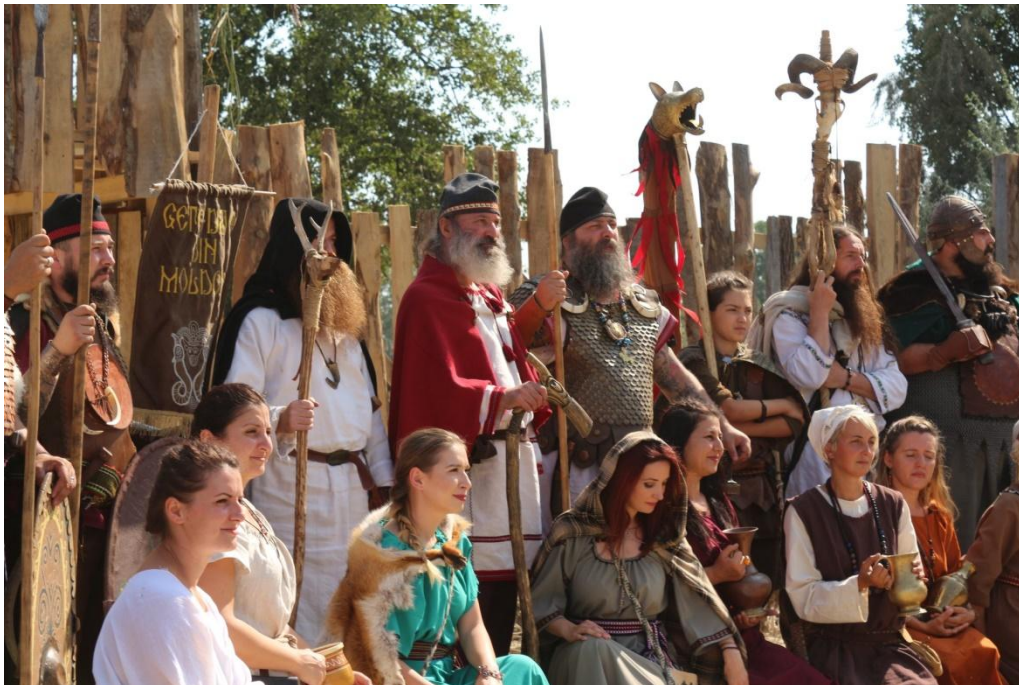
Festivalul Antic Tamasidava, editia a II-a