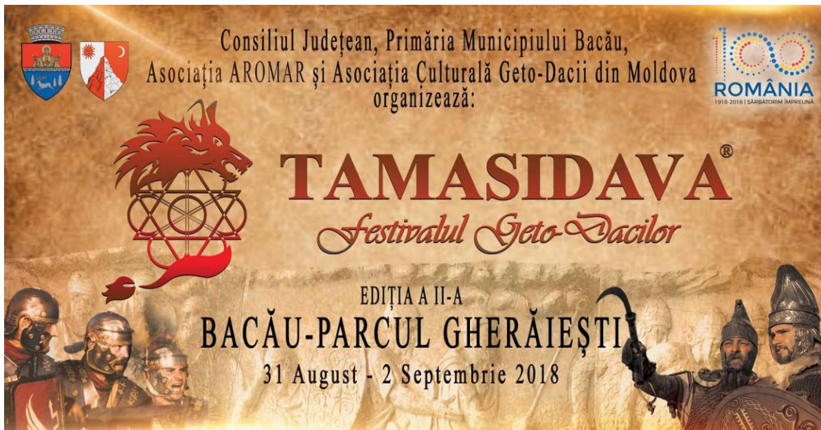
Afișul manifestării „Tamisidava – Festivalul geto – Dacilor”, Ediția a II-a, Bacău, Parcul Ghelăiești, 31 august – 2 septembrie 2018.