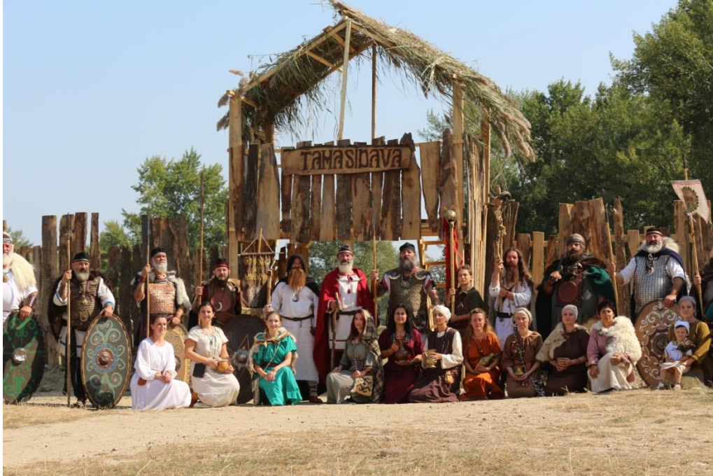
Festivalul Antic Tamasidava, editia a II-a