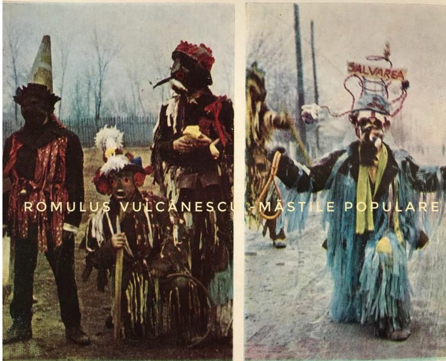
Măști-costume din brezaie, Domnești Ilfov