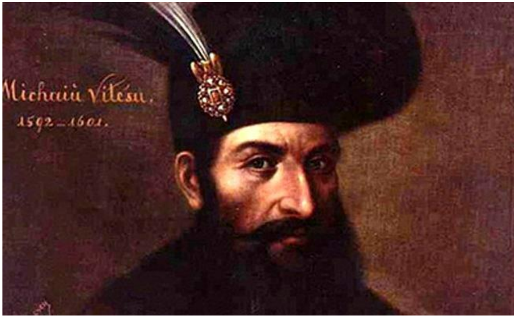
Cuca lui Mihai Viteazul (are pană – ca semn getic al Marii Mame Gaya Vultureanca)