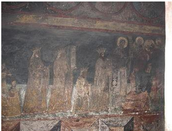
Primii voievozi ai Moldovei purtând coroane