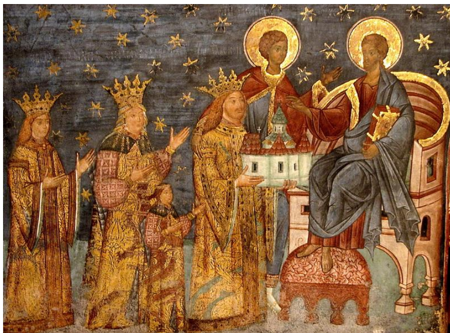
Ștefan cel Mare și familia sa purtând coroane reprezentat la Voroneț