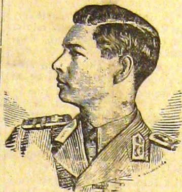
M. S. Regele Mihai I.

Dumnezeul strămoșilor noștri și al Domnitorilor bravi ai acestui neam să ajute Regelui Mihai I ca domnia să-l fie plină de fapte vrednice, de biruință și de glorie și întotdeauna să-l înconjoare iubirea și încrederea supușilor săi.