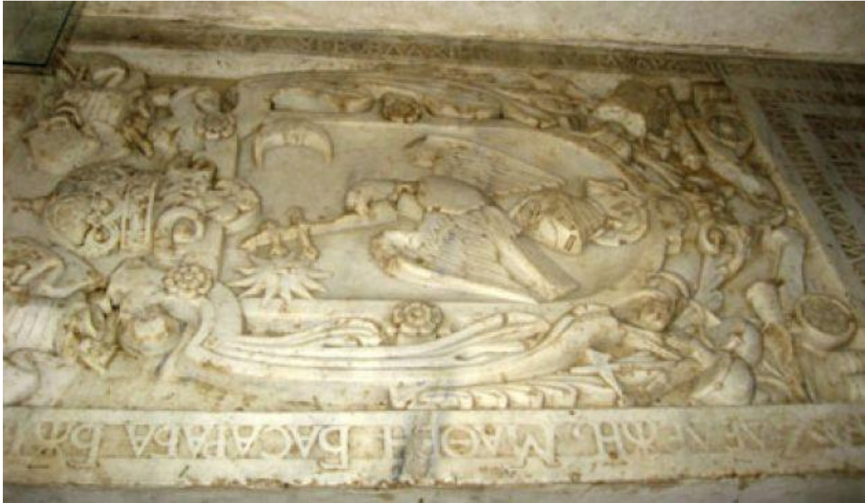
Piatra de mormânt a marelui domnitor al Țării Românești Matei Basarab