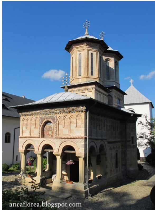
Mănăstirea Dintr-un lemn