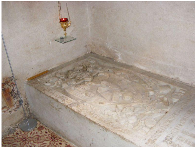
Piatra de mormânt a marelui domnitor al Țării Românești Matei Basarab la Mănăstirea Arnota