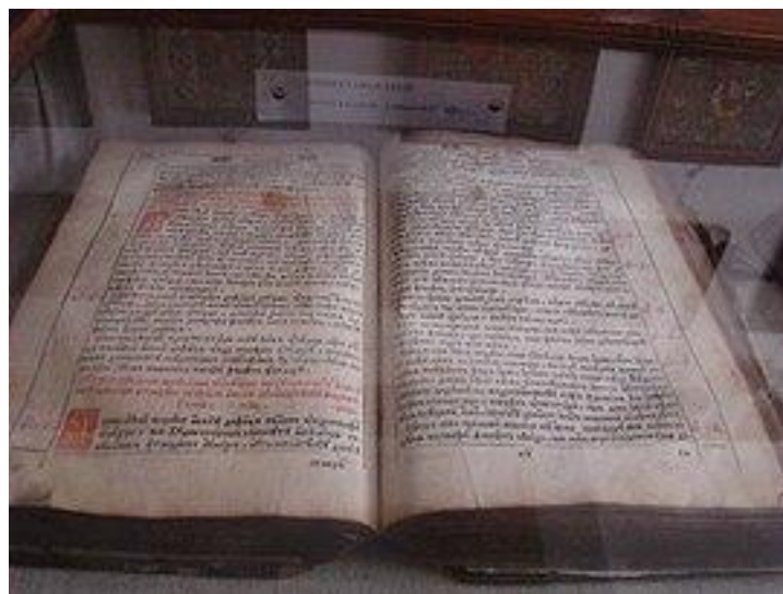
Pravila Îndreptarea legii – apărută în timpul domniei lui Matei Basarab