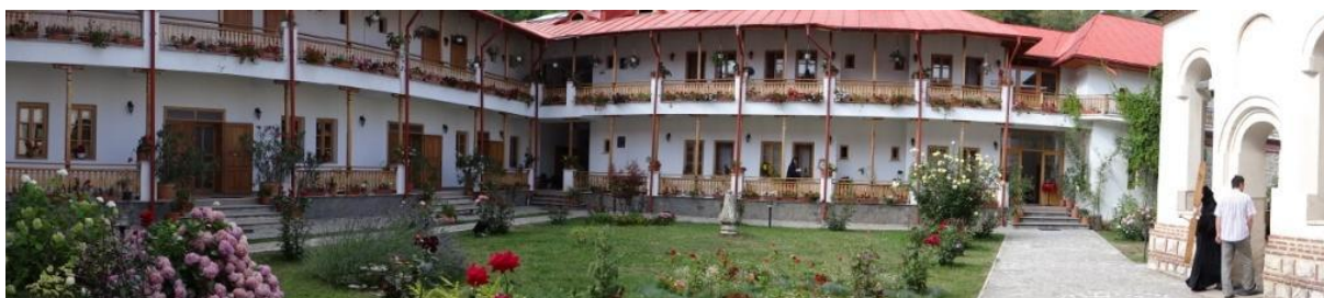
Mănăstirea Arnota, ctitorie a domnitorului Matei Basarab, din vechea casta Basarabă