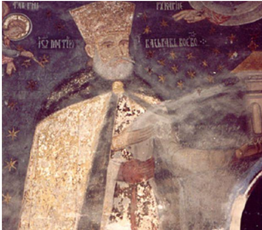
Domnitorul Țării Românești Matei Basarab din vechea castă Basarabă, cu barba albită (cu coroana domnească cap – semn al Cortului Ceresc al Domnului, al Mitrei, al Constelațiilor) – pictură