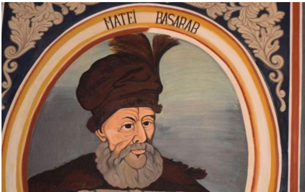
Domnitorul Țării Românești Matei Basarab din vechea castă Basarabă (cu „cuca” domnească pe cap – semn al Cucului, al Craiului, al Domnului singuratic) - pictură