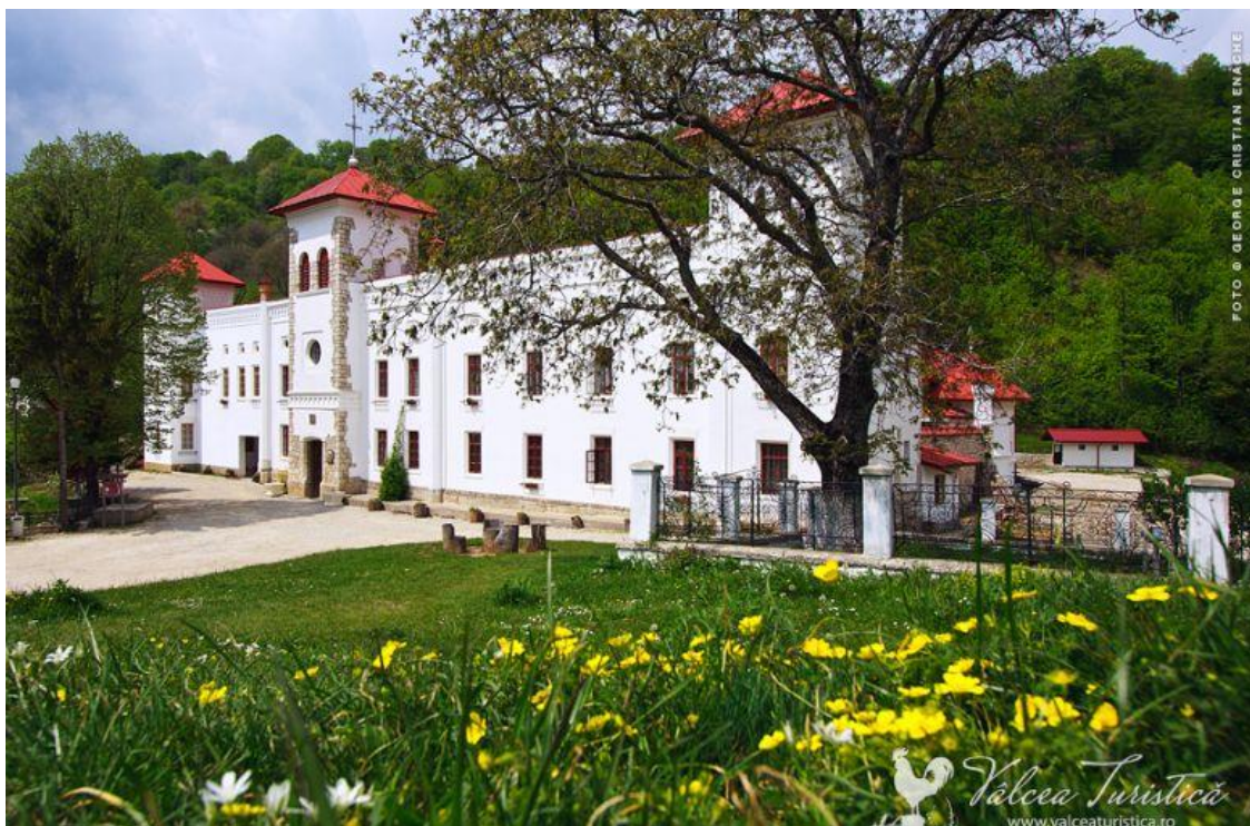
Mănăstirea Arnota, ctitorie a domnitorului Matei Basarab, din vechea casta Basarabă