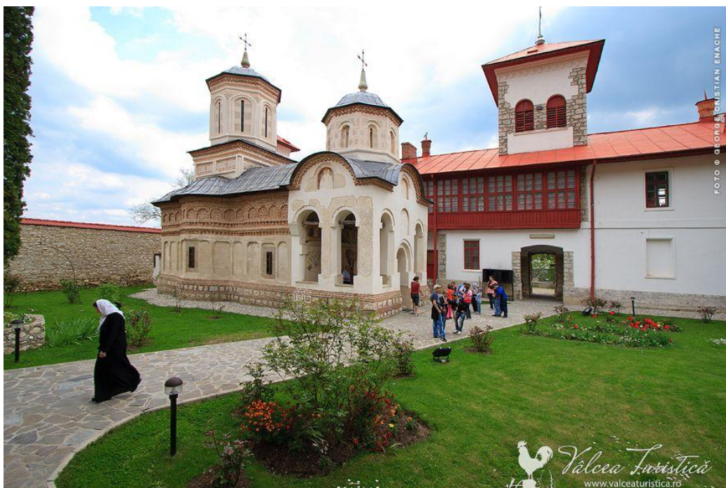
Mănăstirea Arnota, ctitorie a domnitorului Matei Basarab, din vechea casta Basarabă