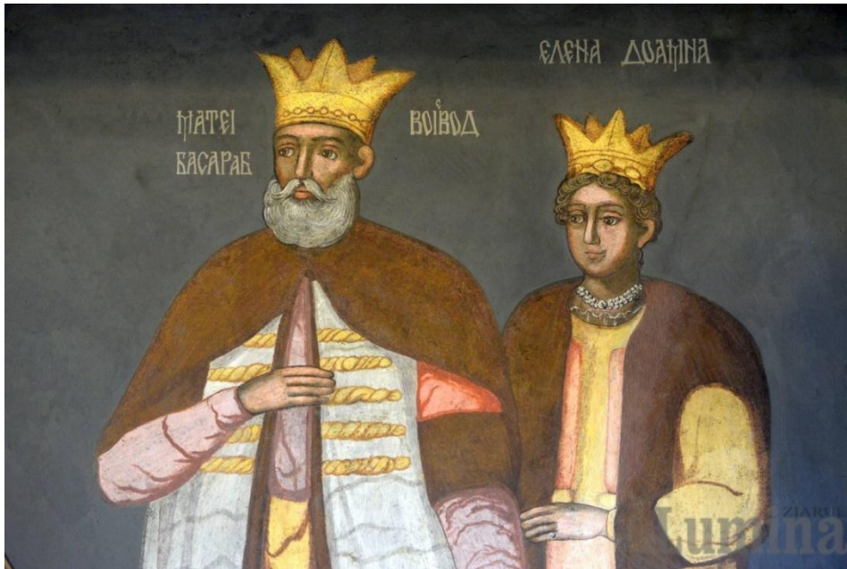
Primitoarea biserică domnească a Sfinților Apostoli. Domnitorul Țării Românești Matei Basarab din vechea castă Basarabă, împreună cu Domna sa Elina.