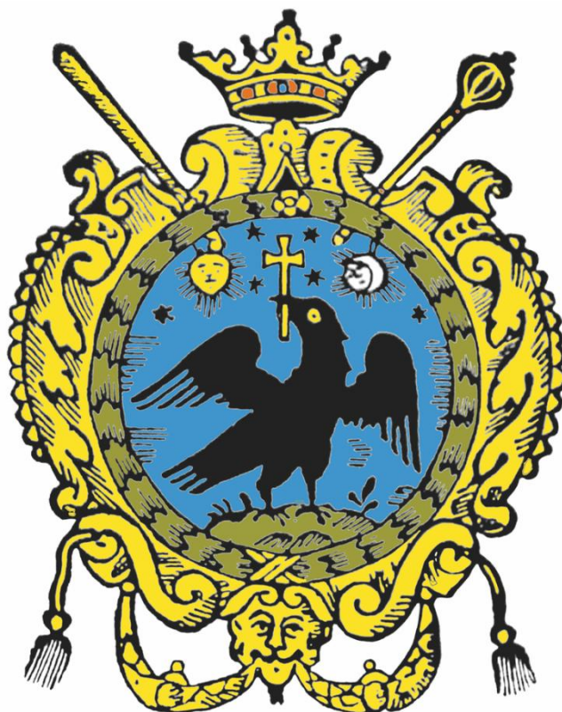
Stema Țării Românești la 1700