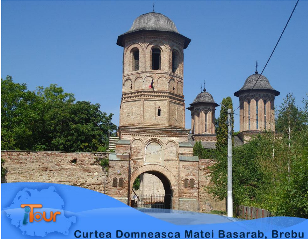
Curtea Domneasca Matei Basarab, Brebu