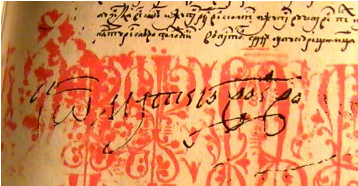
Semnătura lui Matei Basarab