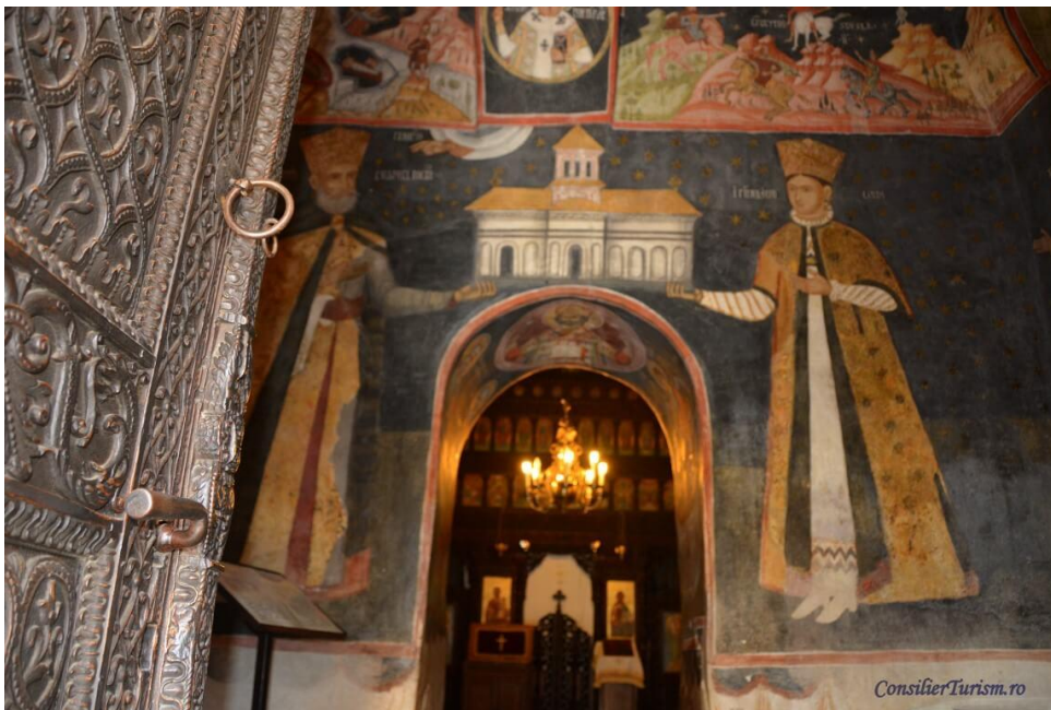
Domnitorul Țării Românești Matei Basarab din vechea castă Basarabă, împreună cu Domna sa Elina. (Mănăstirea Arnota) - pictură