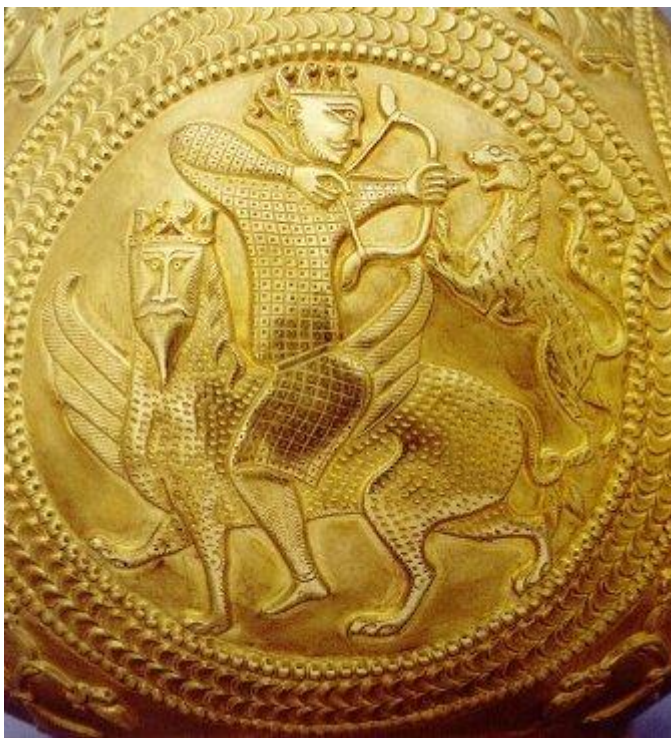
Animal fantastic (cu aripi, corp de leu și cap de om; o Manticora?), pe un vas de aur din Tezaurul de la Sânnicolau Mare (în prezent aflat la Viena – Austria)