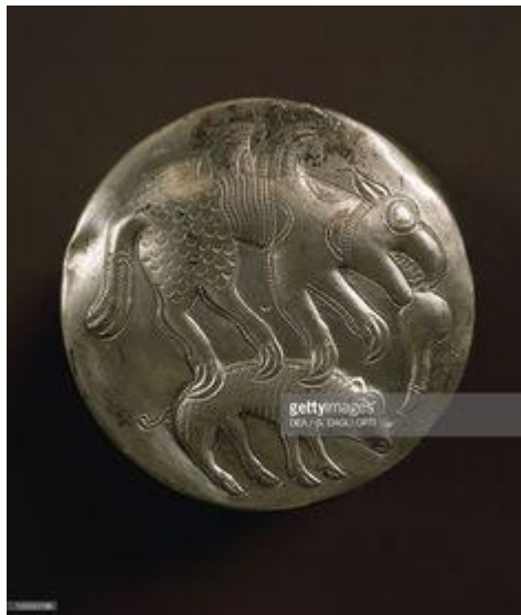
Grifon pe fundul cupei din Tezaurul descoperit la Porțile de Fier ? (aflat la Metropolitan Museum din New York - USA)