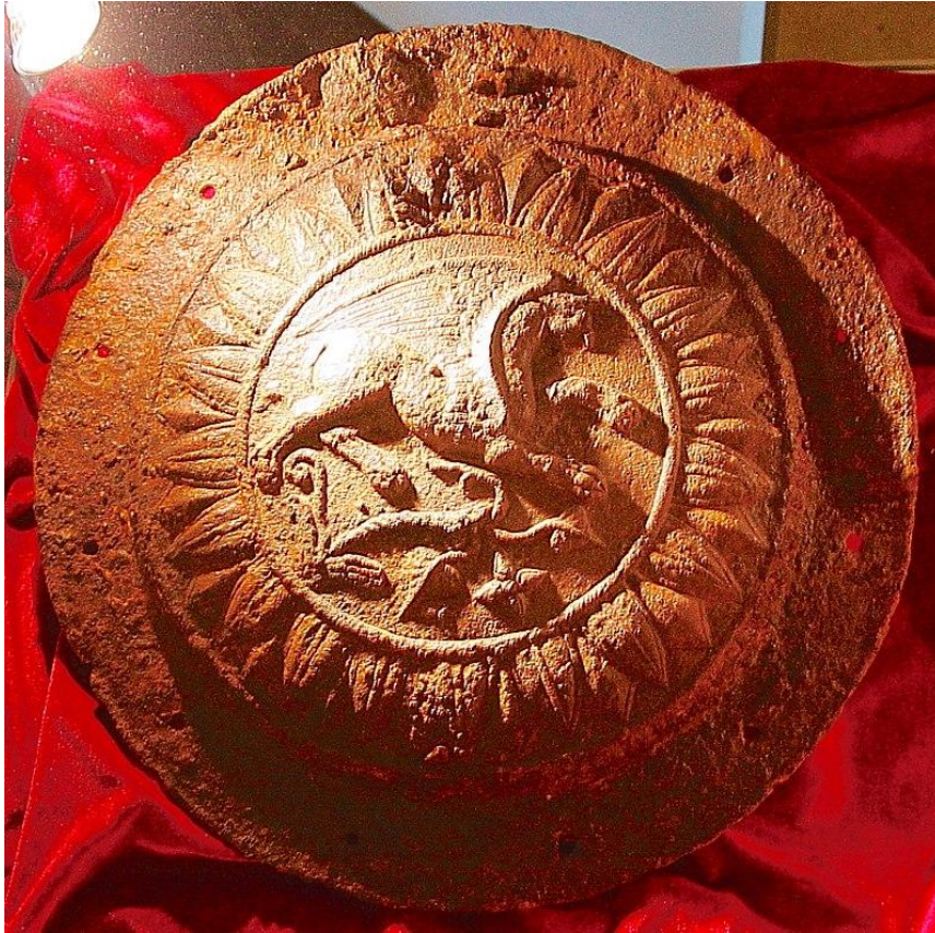
Scutul de fier dacic „cu grifon” descoperit în Cetatea Piatra Roșie (Muzeul Național de Istorie a României din București)