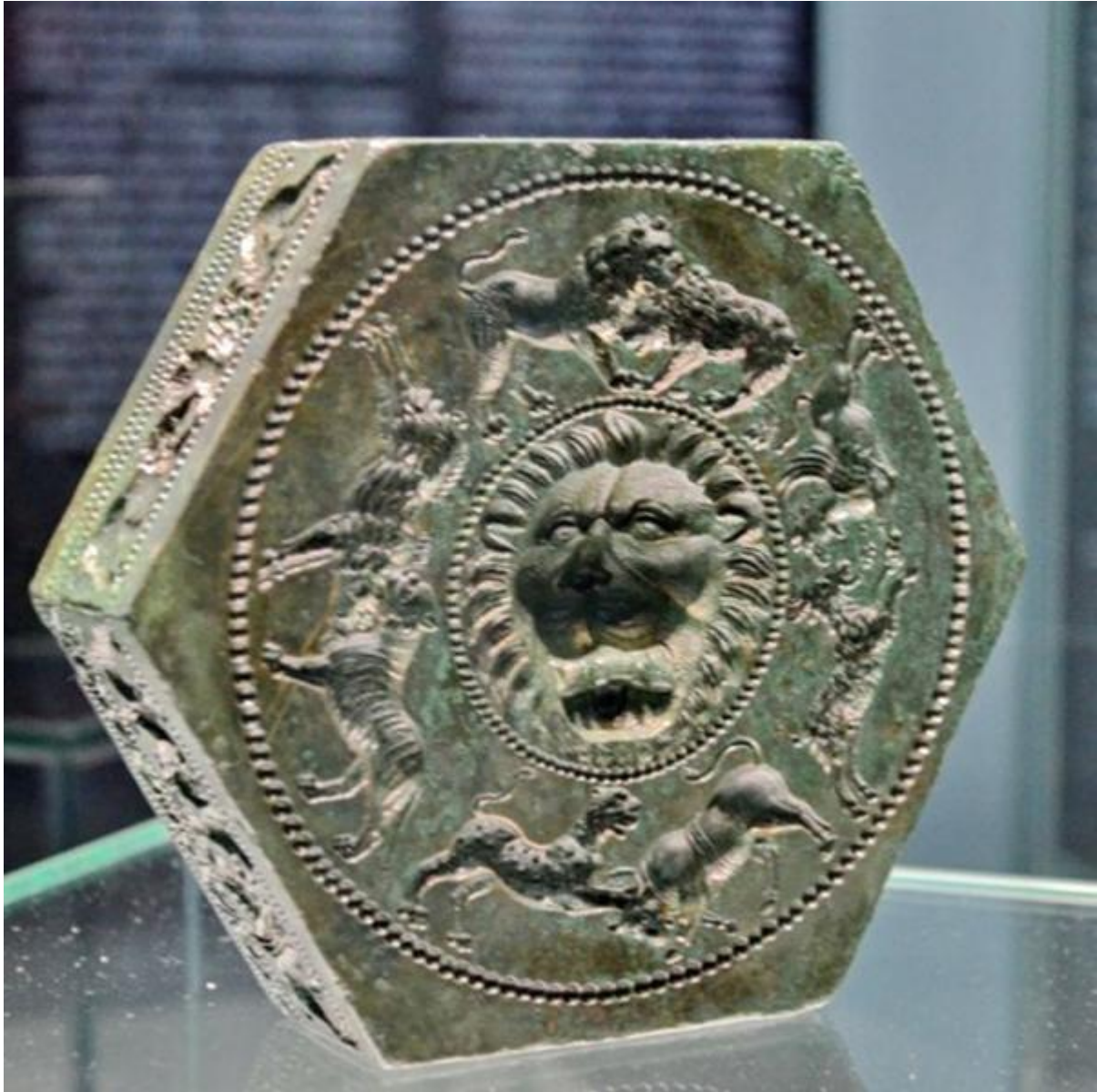
Matrița bijutierului de la Sarmisegetusa Regia – cu grifoni