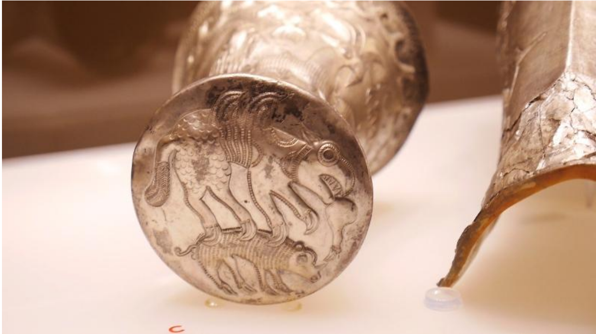
Tezaurul princiar getic de la Agighiol – grifonul de pe fundul cupelor clepsidră (fântâna adâncului)