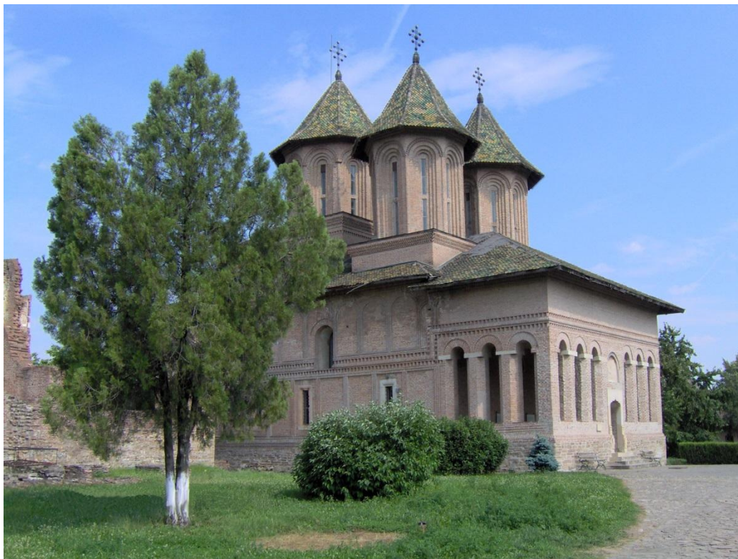
Biserica Domneasca, realizata in timpul lui Petru Cercel, la Târgoviște, unde se află piatra de mormânt a Doamnei Elina