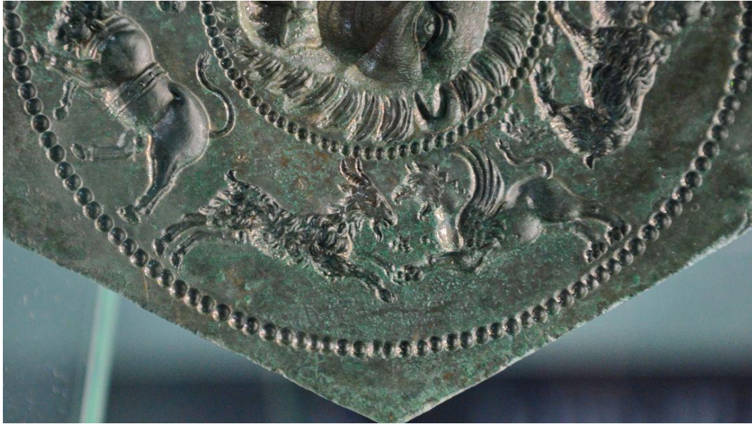
Matrița bijutierului de la Sarmisegetusa Regia – cu grifoni