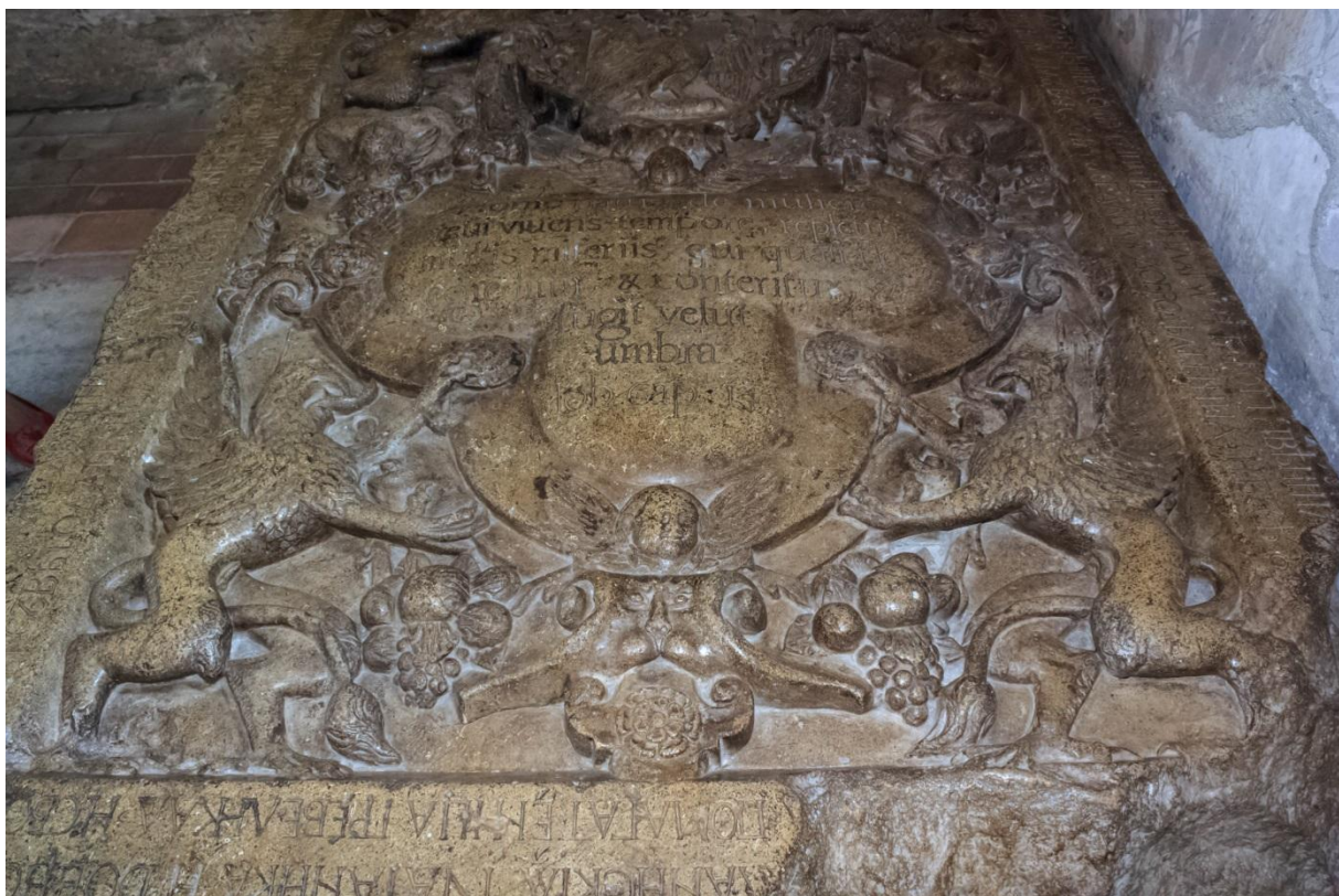
Doi grifoni pe o lespede de mormant aflata la Targoviste