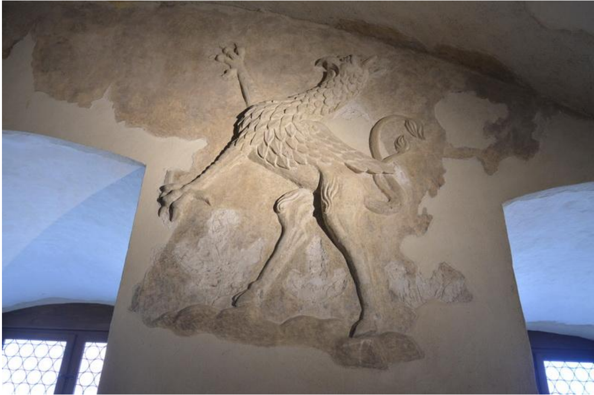
Sala cu grifoni din Cetatea Oradei