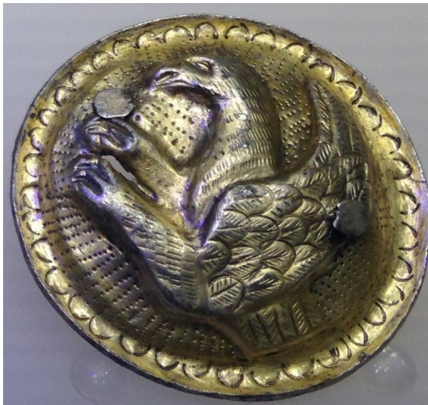
Grifonul din Tezaurul de la Surcea