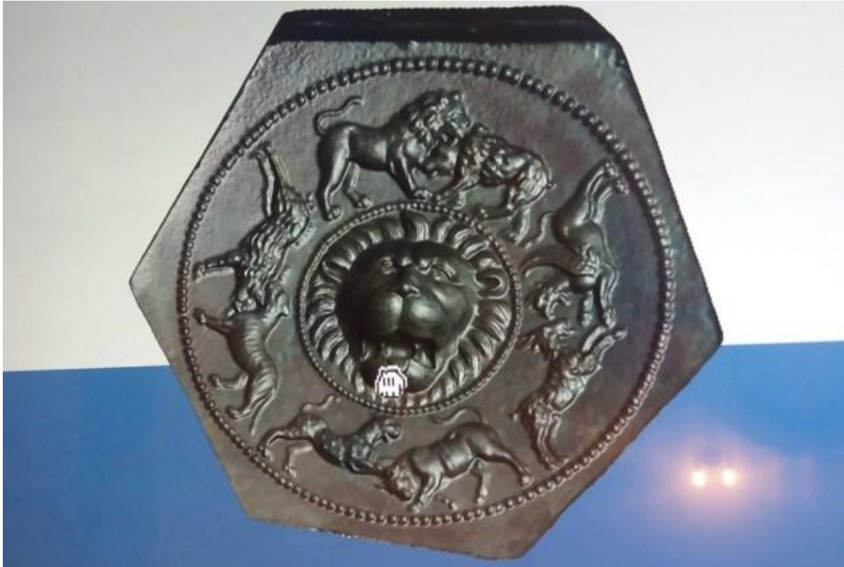
Matrița bijutierului de la Sarmisegetusa Regia – cu grifoni