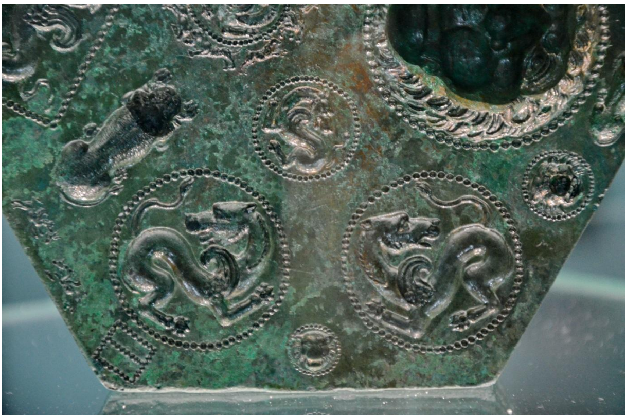
Matrița bijutierului de la Sarmisegetusa Regia – cu grifoni