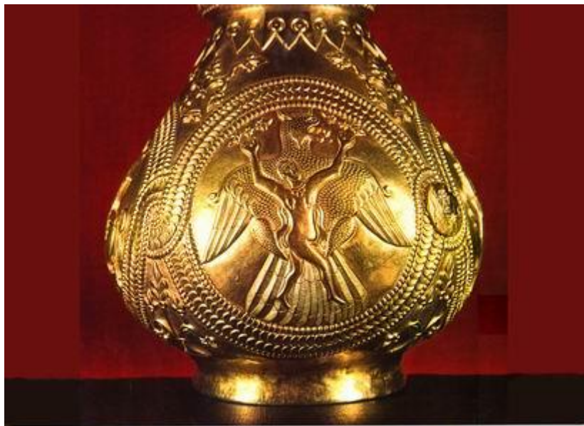
Zgripturoaica – o pasăre fantastică pe un vas de aur din Tezaurul de la Sânnicolau Mare (în prezent aflat la Viena – Austria).