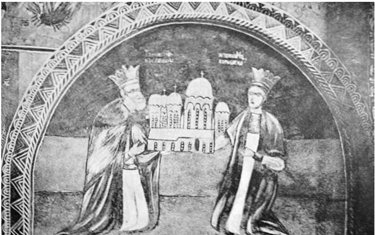
Domnitorul Matei Basarab și Doamna Elina