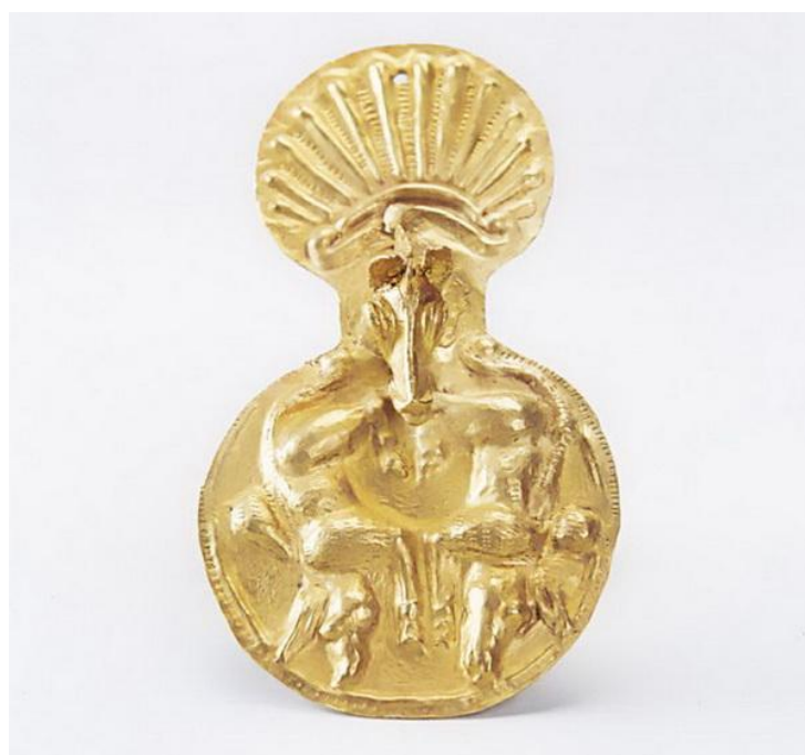
Aplica vestimentară în formă de vioară (posibil frontal de cal – piesă de harnașament) din tezaurul de la Cucuteni-Băiceni, județul Iași (secolul V- IV î.Hr.)