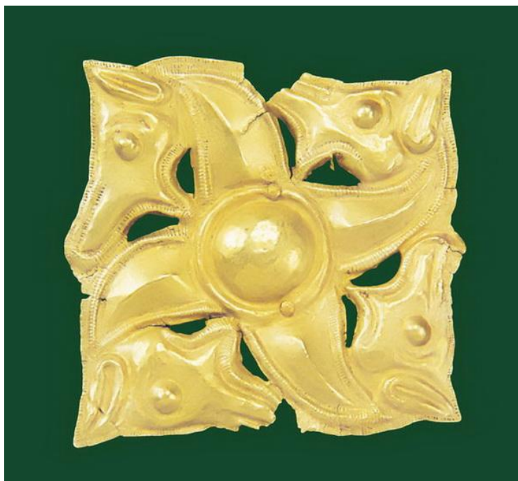
Aplică pătrată de aur (sauwastika) de harnașament din tezaurul de la Cucuteni-Băiceni, județul Iași (secolul V- IV î.Hr.)