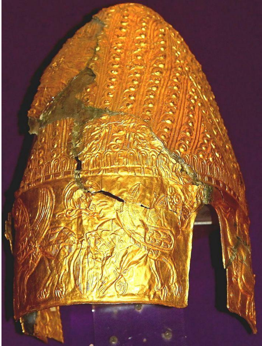
Tezaurul Frăției Getice de la Cucuteni-Băiceni, județul Iași (secolul V- IV î.Hr.) – Coiful de paradă și ritual