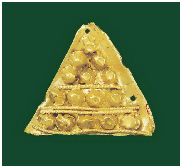
Aplica de harnașament din aur- Tezaurul Frăției Getice de la Cucuteni-Băiceni, județul Iași (secolul V- IV î.Hr.) – Piramida sau triunghiul