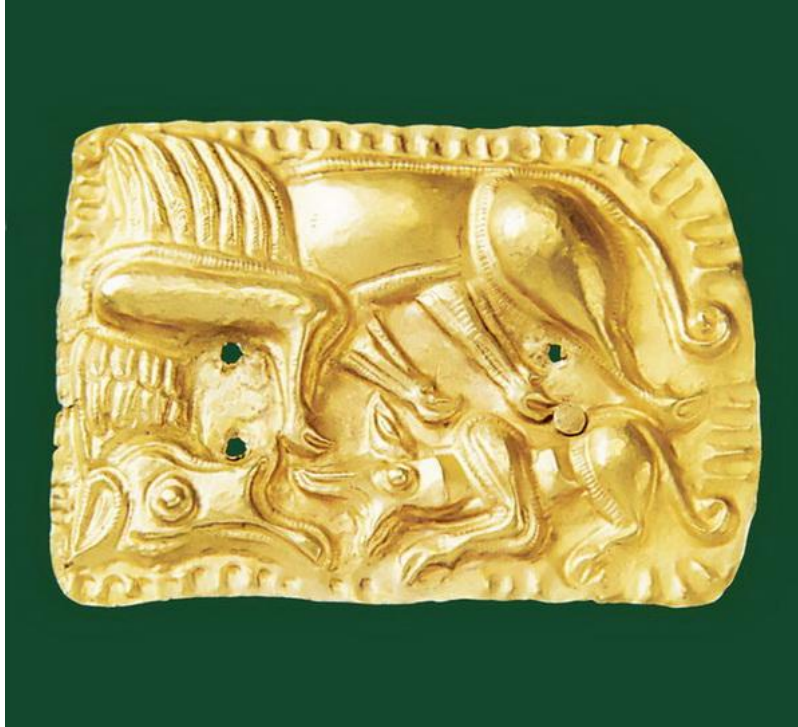
Aplica de harnașament din aur- Tezaurul Frăției Getice de la Cucuteni-Băiceni, județul Iași (secolul V- IV î.Hr.) – Lupul și Pegasoleonul.