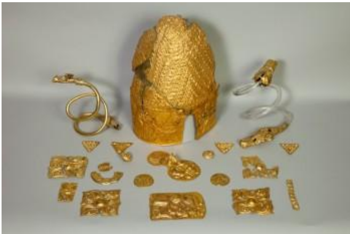
Tezaurul principelui get membru al Frăției Getice , de la Cucuteni-Băiceni, județul Iași (secolul V-IV î.Hr.)