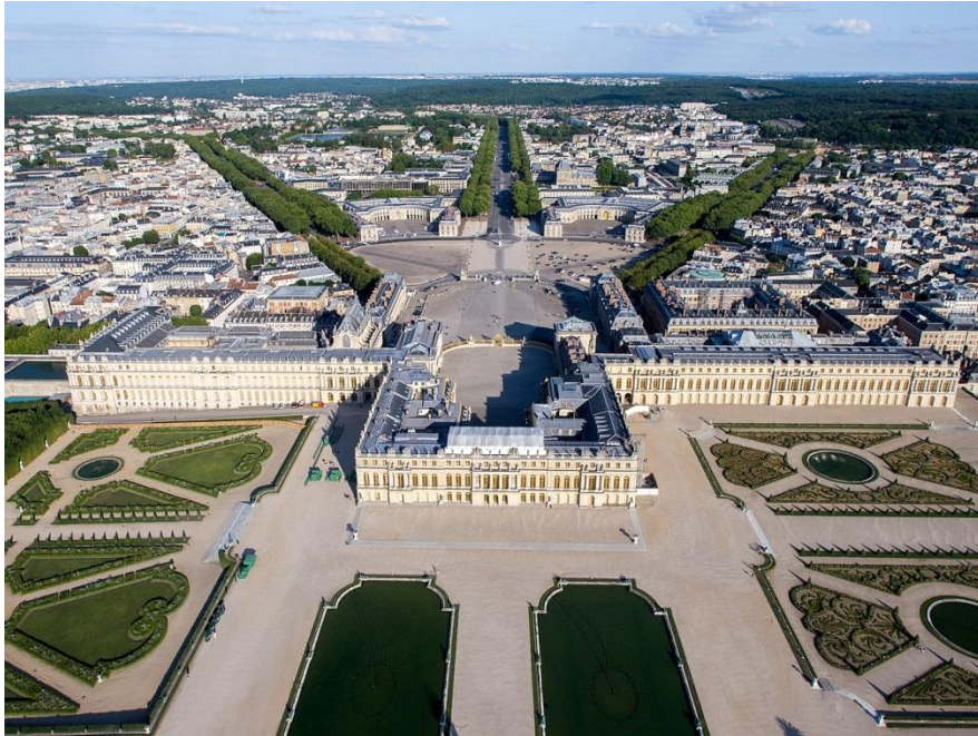
Palatul Versailles – Franța – Vedere aeriană