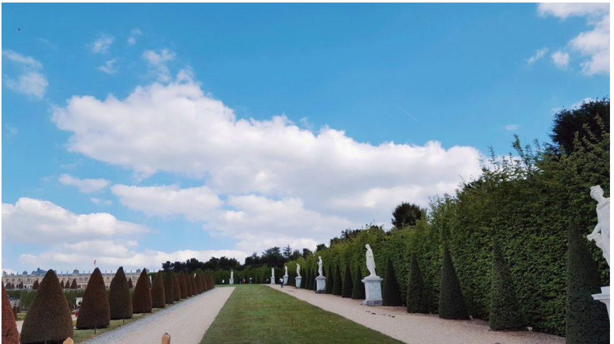
Palatul Versailles – Franța – Aleile cu statui