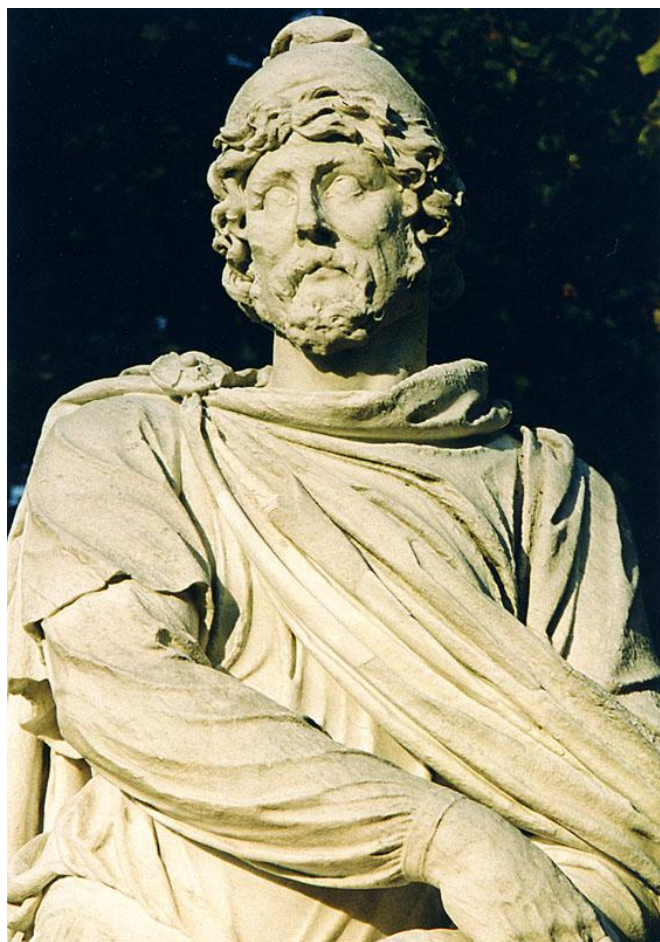
Statuie de tarabostes dac, pe aleile Grădinii Palatului Versailles – Franța. Poartă boneta frigiană („care frige”; focul din cer) caracteristică.