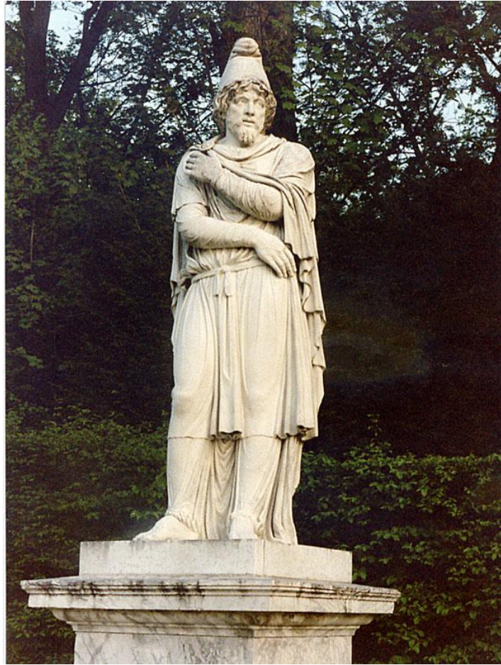
Statuie de tarabostes dac, pe aleile Grădinii Palatului Versailles - Franța